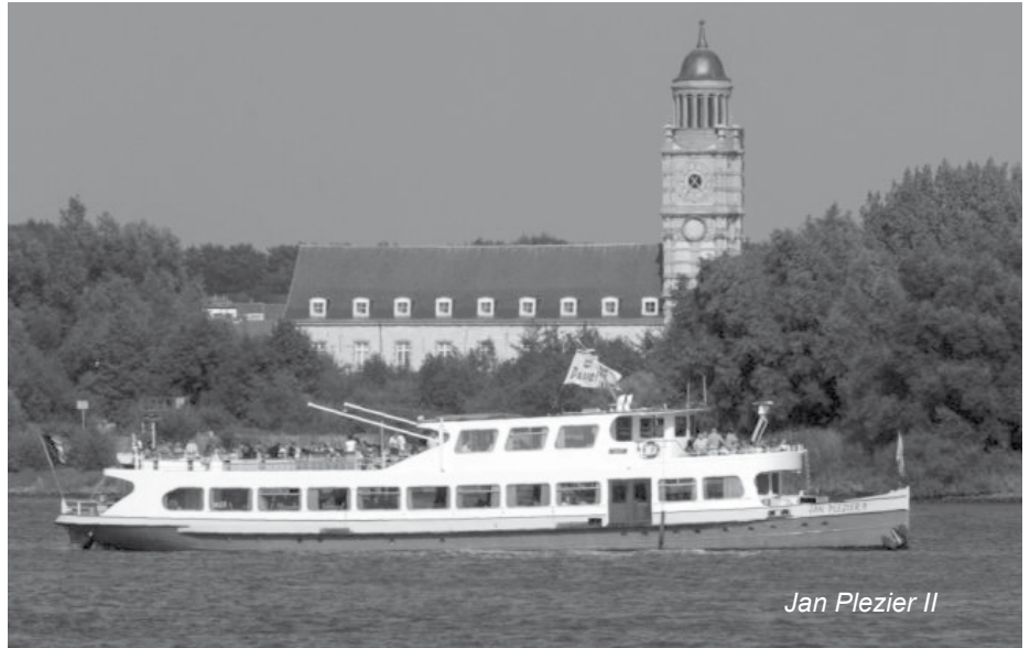
Jan Plezier II

Het is sinds januari 2005 geleden dat we de overwinterende watervogels konden bewonderen van op het water. De boottocht kende toen een groot succes zowel wat betreft aantal deelnemers als waarnemingen. Van de eenden zijn wintertaling, wilde eend, tafeleend en krakeend de belangrijkste overwinteraars. Met uitzondering van wilde eend komt meer dan 1 % van de totale Noordwest-Europese populatie overwinteren in de Zeeschelde. Voor krakeend is dit zelfs meer dan 6 %. Voor Vlaanderen betekent dit dat de Zeeschelde in de winter 50 tot 60 % van de win-