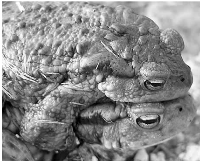
Paddenkoppel in amplexus

Theorie: Bart Hellemans - Praktijk: Danny Jonckheere