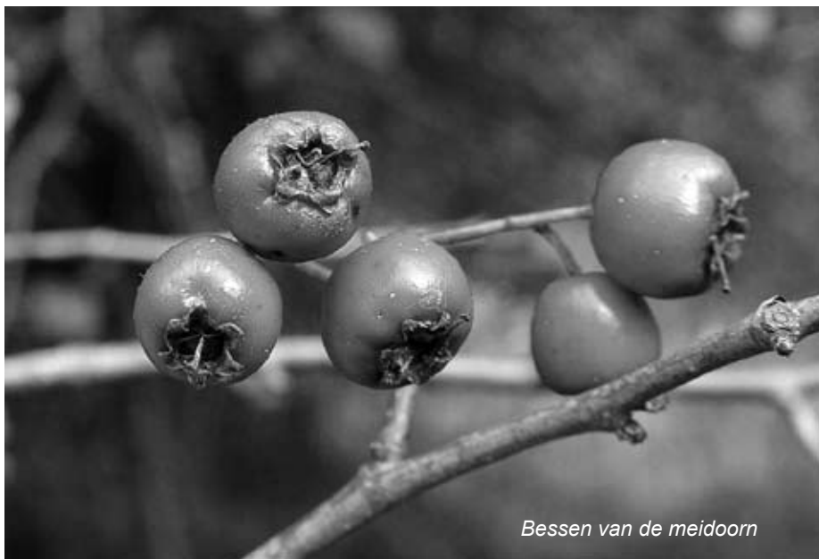
Bessen van de meidoorn

Soorten: zwarte els, grauwe wilg, schietwilg, boswilg, Gelderse roos en