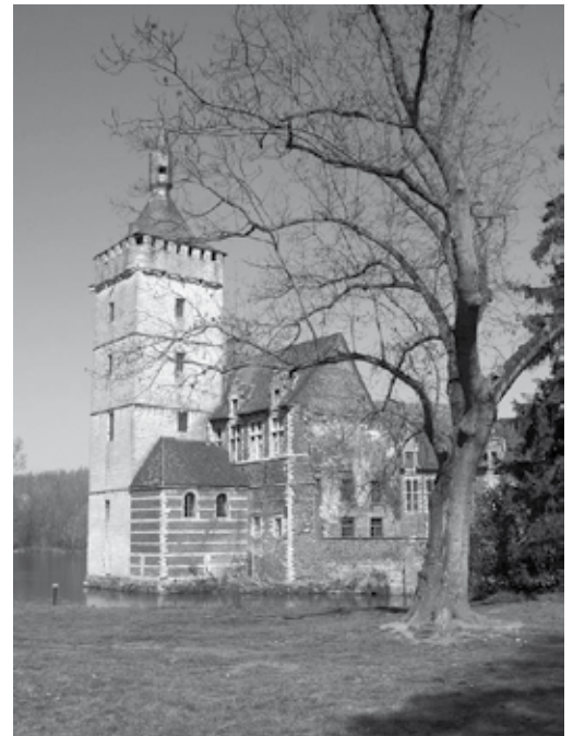
Kasteel van Horst

Praktisch: vertrek om 8.15 u in Hoboken, Kioskplaats (parking) met eigen wagens (kostendelend samenrijden aan 5 eurocent/km, d.w.z. ca. 6 euro/persoon). Aansluiten om 13u45 nabij St.-Joris-Winge voor het namid-