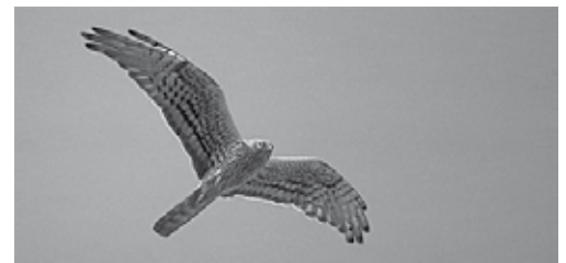
Grauwe kiekendief op doortrek - Potentiële schietschijf op Malta

Een toemaatje: iedere aanwezige ontvangt gratis het laatste nummer van 'Mens en Vogel', het mooi geïllustreerde tijdschrift van Vogelbescherming Vlaanderen. Wie deze avond besluit lid te worden van Vogelbescherming (15 euro/jaar) krijgt ineens als welkomstgeschenk een prachtige zelfbouwnestkast mee van 'Dieren in Nesten' (waarde 9,95 euro).