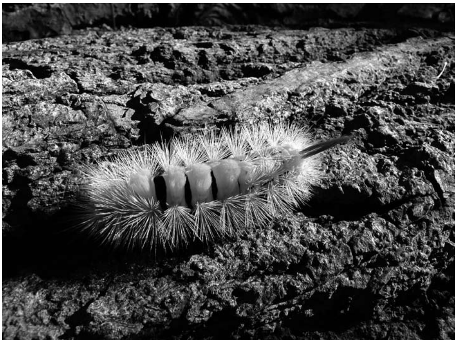
Rups van Meriansborstel

overwintert als pop in een dunne zijdeachtige cocon die gevormd wordt op de waardplant of in de strooisellaag. De vlinders vliegen van begin april tot begin juli, in 1 generatie. Als de vlinder wordt waargenomen, dan valt onmiddellijk de houding op. De vlinder rust namelijk met de ruigbehaarde poten naar voren uitgestrekt.