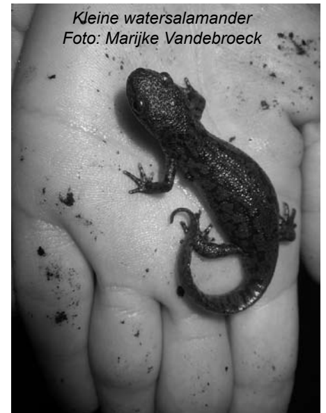
Kleine watersalamander

De driedelige cursus kost 18 euro voor Natuurpuntleden en 23 euro voor niet-leden. Inschrijving is definitief na storting van het deelnamebedrag op rekening BE88 9799 7675 4841 van Natuurpunt Aartselaar met als mededeling “ Cursus amfibieën ” en je telefoonnummer en/of mailadres.