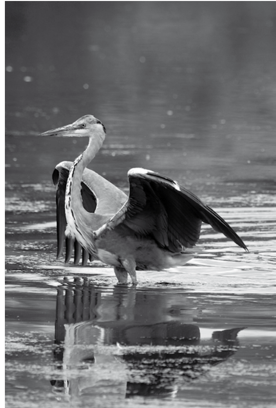
Blauwe reiger

De Uitkerkse Polder is een 1.400 ha grote authentieke kustpolder. Zo'n 1500 jaar terug lag er een uitgestrekt slikke- en schorregebied zoals we vandaag in het Land van Saeftinghe aantreffen. Maar de omgang van de mens met het getijdenlandschap gaf ons de polders. De geulen slibden vanaf de 6de eeuw dicht, waardoor de schorre evolueerde naar zoute weiden waarop de Middeleeuwse mens schapen kon laten grazen en boerderijen kon bouwen. Hun boerderijen beschermde ze met lokale ringdijkjes. Het prille begin van de huidige oostkustpolder. En de mens werkte verder. In het gevecht tegen het water