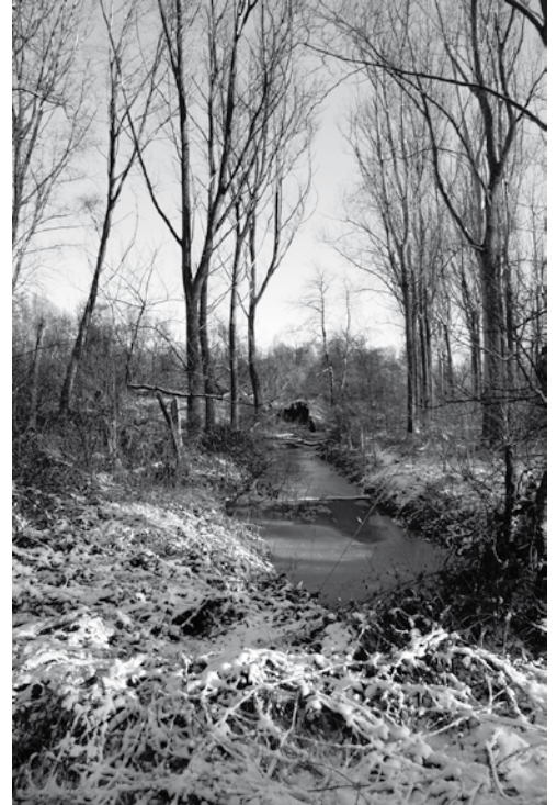
Winter in de Polder

Meebrengen: warme kledij, die vuil mag worden, warme laarzen en vooral heel veel goede luim om dit voorbereidend en reddend werk voor onze amfibieën te realiseren, ... Wij zorgen voor alle materialen (spades, werkhandschoenen, ...)