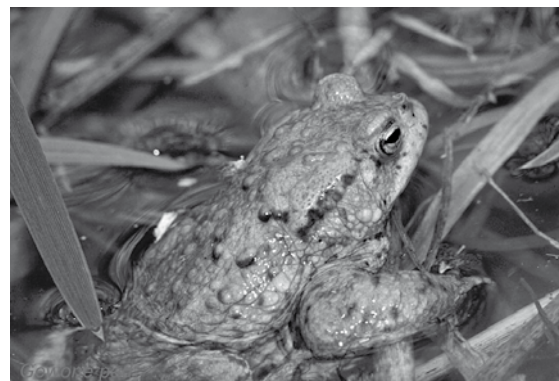
Gewone pad - Foto: Fons Van den heuvel

Tijdens de actie zelf neem je best contact op met één van beide coördinatoren.