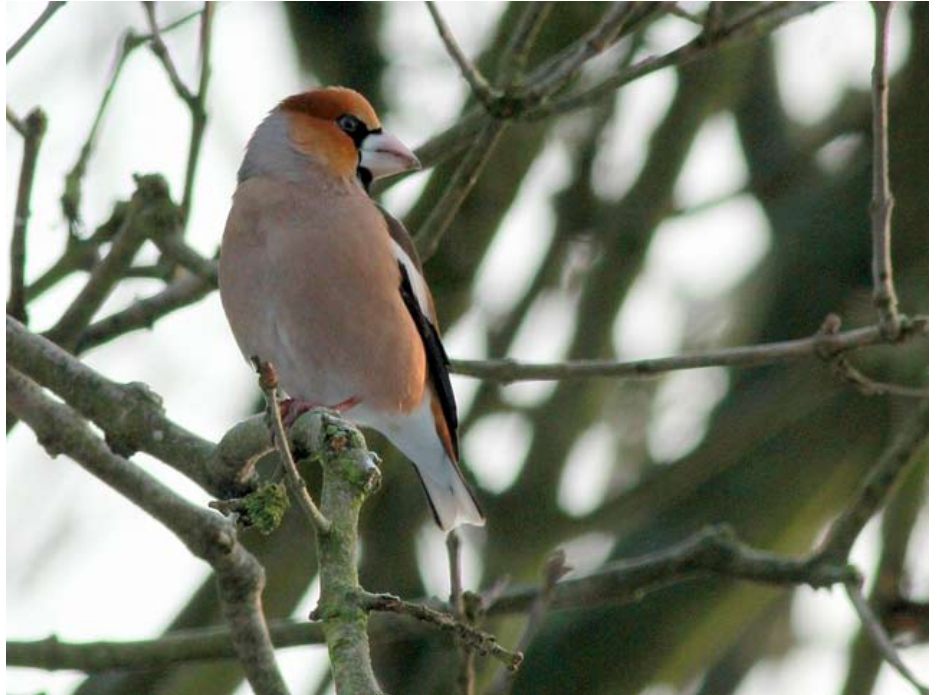
Appelvink