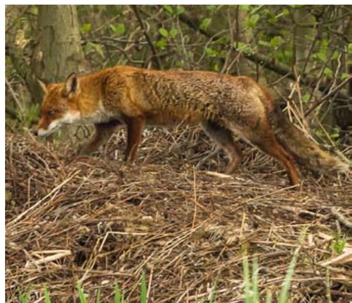
Vos op jacht in de Hobokense Polder