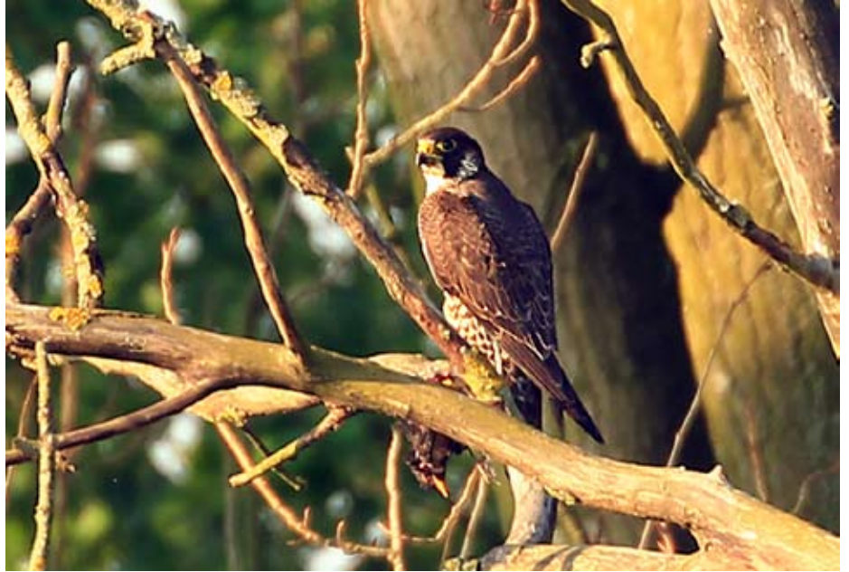
Juvenile slechtvalk met prooi

Niet getreurd echter, de hoop op een langdurige vestiging van de slechtvalken op het Kiel blijft intact. Het nieuw samengesteld koppel is permanent aanwezig op de Christus Koningkerk en zal volgend jaar zéker voldoende rijp én geoefend zijn voor een vruchtbare paring. Als tegen dan ook de buitenwerkzaamheden aan de Silvertoptorens klaar zijn, zoals gepland, staat niets een échte ingebruikname van de broedkast in de weg. In de tussentijd blijven we de vogels volgen, want hun verhaal schrijven ze natuurlijk altijd zelf.