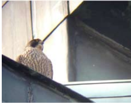
Juvenile mannelijke slechtvalk