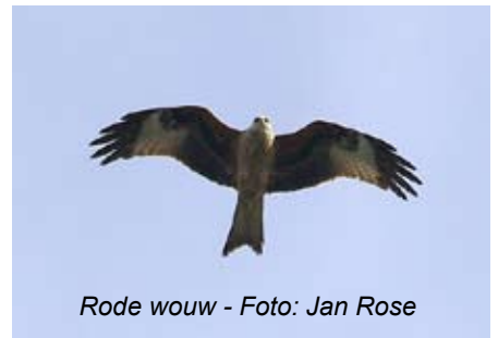
Rode wouw