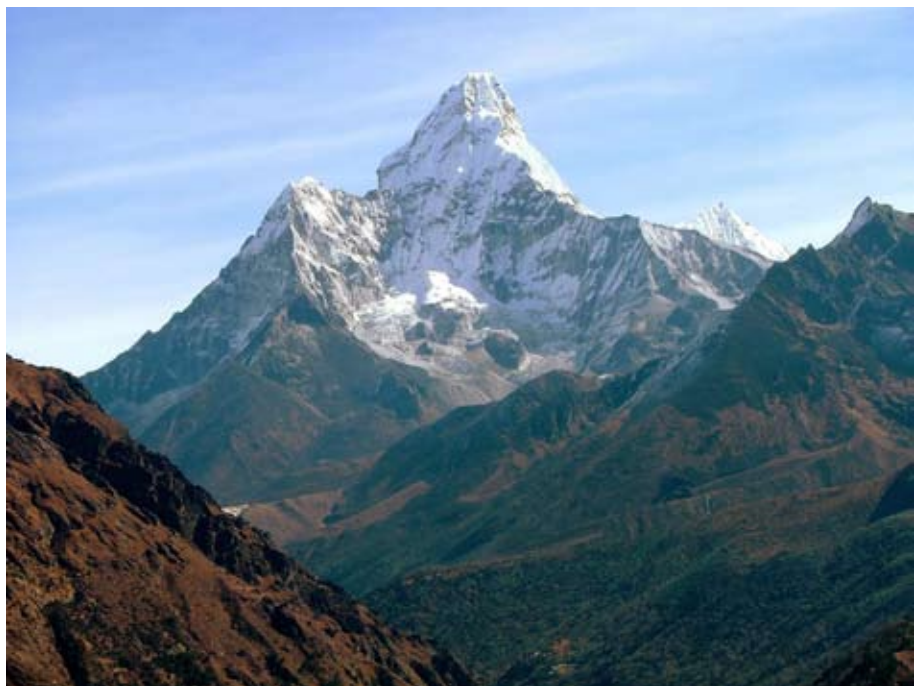
Mount Everest: de top van Moeder Aarde

Ontelbare soorten planten en dieren van allerlei vormen, van microscopische kleine bacteriën tot zware walvissen, bevolken onze planeet en vormen één grote samenleving. We kunnen de aarde best vergelijken met een sinaasappel. Het deel van onze planeet waar alle leven in te vinden is, is dan niet dikker dan de oranjeschil van de sinaasappel. Enkel in de buitenkant in een dunne laag zit alle leven bij elkaar. In werkelijkheid is de schil van de aarde natuurlijk niet echt dun, dat besef je zo als je weet dat de hoogste berg, de Mount Everest 8840 m hoog is, terwijl het laagste punt 11,033 m onder de zeespiegel ligt, namelijk in de Marianentrog in de Stille Oceaan. Alle leven is te vinden op of onmiddellijk onder of boven het aardoppervlak. Die buitenlaag met alle leven noemen we de Biosfeer. Bio is een Grieks woord en betekent leven, sfeer betekent bol. Een bol vol leven. De biosfeer, met haar planten, dieren en mensen, maar ook met haar bodem, lucht en water, kortom met alles wat de natuur rijk is.