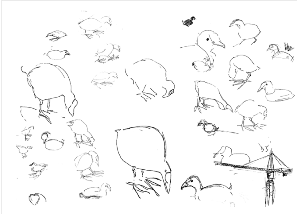
Meerkoetschetsen van Monica Carro Muino