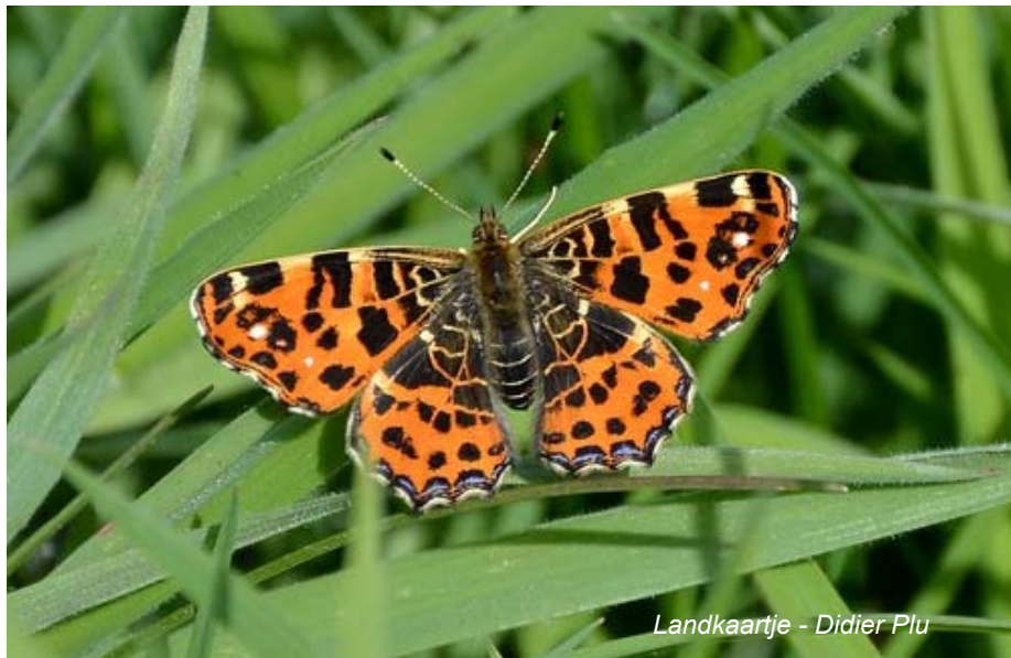
Landkaartje - Didier Plu

Het was gedurende de ganse periode buitengewoon zacht lenteweer en uitstekend weer voor heel wat vlindersoorten. Volgende soorten werden waargenomen: atalanta (DJ, JP, LS, PB), bont zandoojje (AVL, AH, DS, EMO, JP, MD, MW, PB, PV, TV, en WM), boomblauwtje (EMO, JP, KB, ML, MW, PB en WM), ci-troenvlinder (BM, DJ, JP, PB, TV en WM), dagpauwoog (AVL, AH, BM, DS, DJ, ER, EMO, JP, KL, KB, LS, ML, MW, PB, TV en WM), distelvlinder (WM), gehakelde aurelia (BM, GB, JH, JP, JC, KB, ML, MW, PB, TV en WM), groot koolwitje (AH en JR), hooibeestje (PB en WM), icarusblauwtje (EMO, JP, LS, ML, MD, PB en WM), klein geaderd witje (EMO, JP, PB, en TV), klein koolwitje (AH, DS, JP, KB, MW en