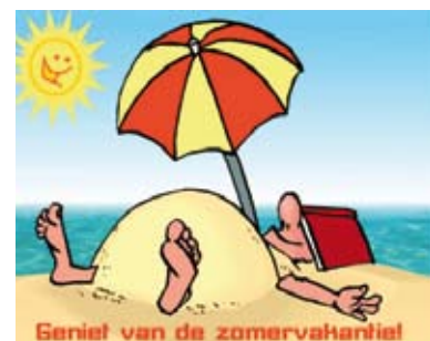
Geniet van de zomervakantie!