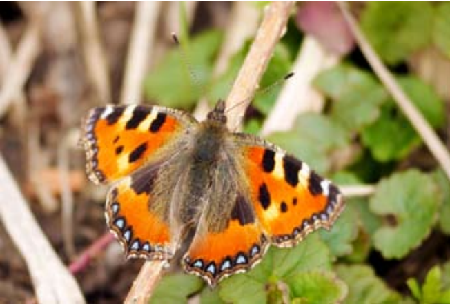
Kleine vos

We maken een wandeling van ongeveer 5 kilometer langs de interessantste vlinderplekjes in de Hobokense Polder.