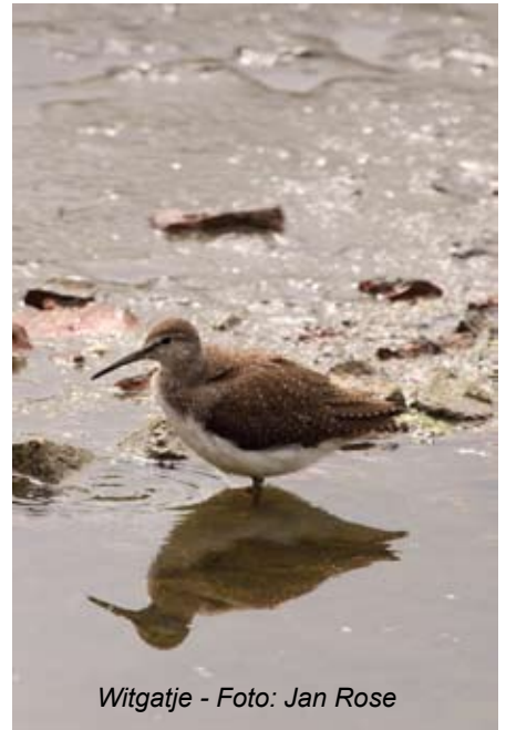
Witgatje - Foto: Jan Rose