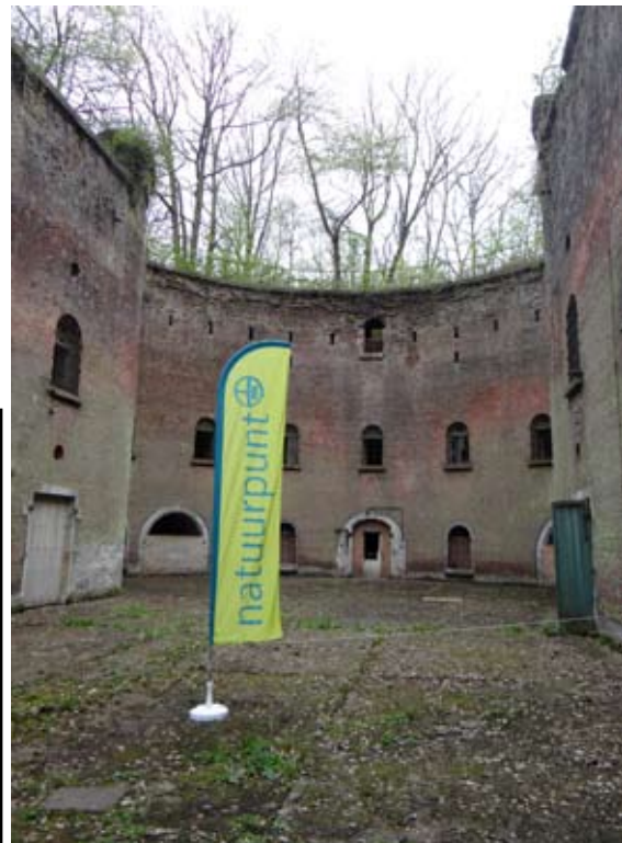
Fort 8

Niet-leden betalen 5 euro. Maar: in het kader van de grote zomerledenwervingscampagne kan je ook lid worden van Natuurpunt voor 24 euro. Je bent dan lid tot einde 2015. EN: je kan GRATIS deelnemen aan de grote happening op zondag 28 september met o.a. boottochten op de Schelde, een waaier aan toffe (gezinsvriendelijke) activiteiten op het Steenplein en in de Hob. Polder.