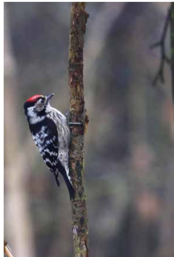
Kleine bonte specht - Jan Rose