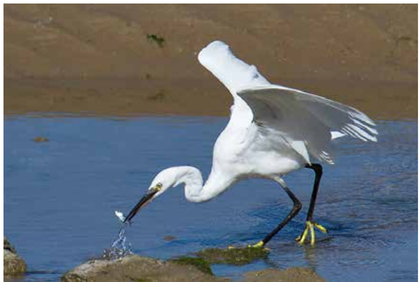
Kleine zilverreiger - Rudi Debruyne

Meebrengen: laarzen of stevige wandelschoenen, verrekijker (eventueel een telescoop), fototoestel, vogelgids en lunchpakket.