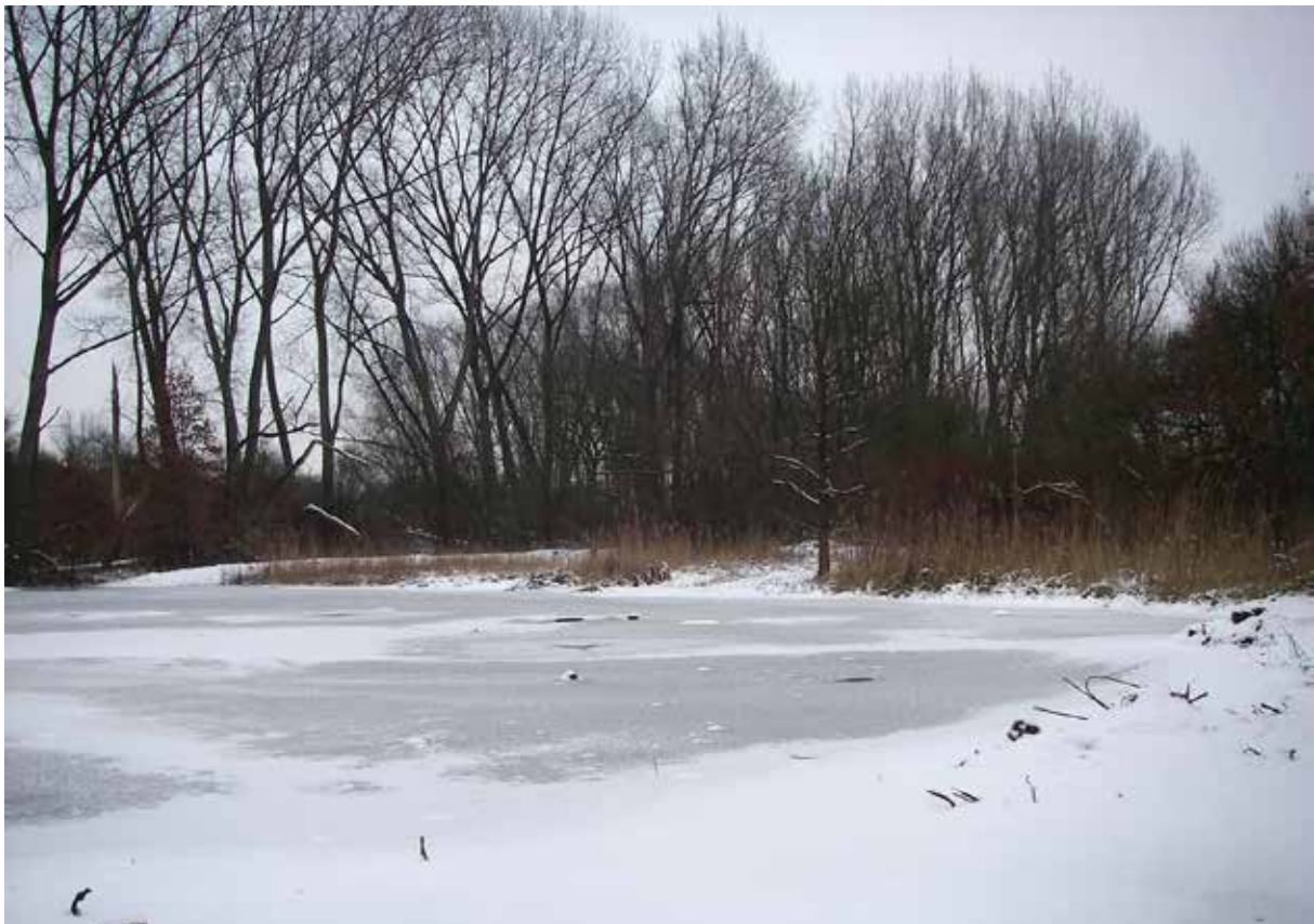
Winter in de Hobokense Polder

ARDEA website en blog via www.hobokensepolder.be - Mail: ardea@hobokensepolder.be