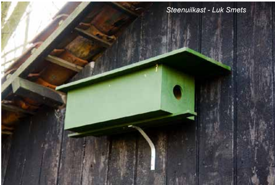
Steenuilkast - Luk Smets

willen doen. Uiteraard blijft ARDEA ook in de toekomst een zeer gevarieerd aanbod van vogel-activiteiten aanbieden. Maar meer dan vroeger steken we de komende jaren ook de handen uit de mouwen om effectief wat te doén voor die vogels. (En oja: we gaan wat minder vergaderen en beperken ons tot één jaarlijkse ARDEA-meeting in oktober.)