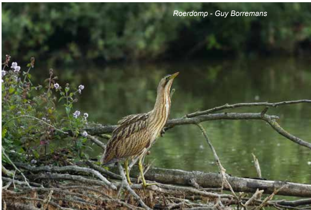
Roerdomp - Guy Borremans

Grote zilverreigers waren gedurende de ganse periode te zien in de HP en langs de Schelde. In augustus en september pleisterden of foera-