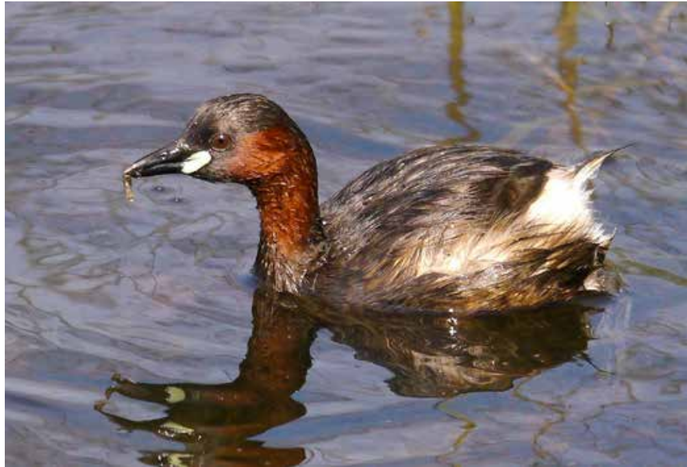
Dodaars - Guy Borremans

Park Kielse Vest: jan_de_bie@telenet.be - 0479/97 67 03