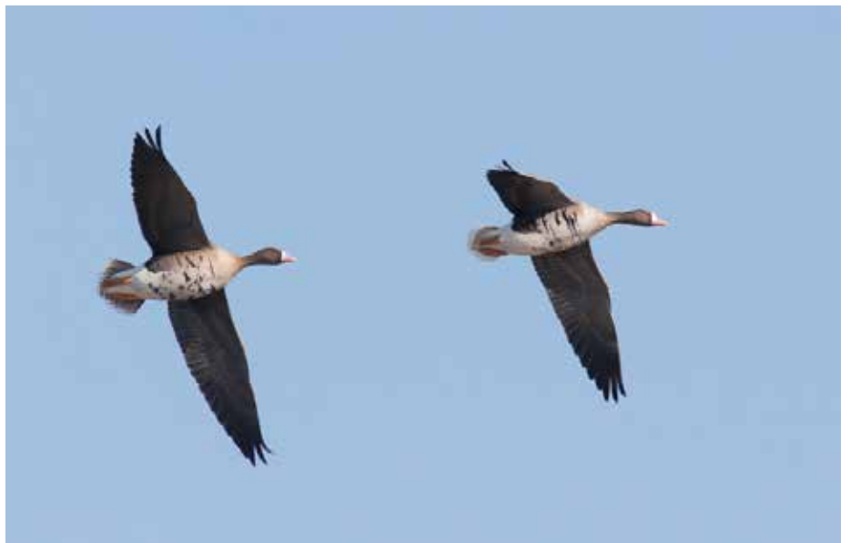
Kolganzen in de vlucht - Joachim Pintens

Nu ARDEA quasi drie jaar bestaat en zijn draai begint te vinden, verleggen we de focus een beetje; aanvankelijk verkenden we het werkingsgebied en gingen we op zoek naar geïnteresseerden en medewerkers. De grote respons op onze activiteiten maakte duidelijk dat heel veel mensen in de zuidelijke rand van Antwerpen aan vogelstudie en -bescherming