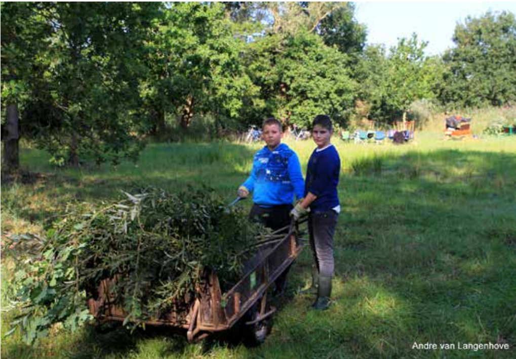
Andre van Langenhove

Tekst: Roger Desmedt