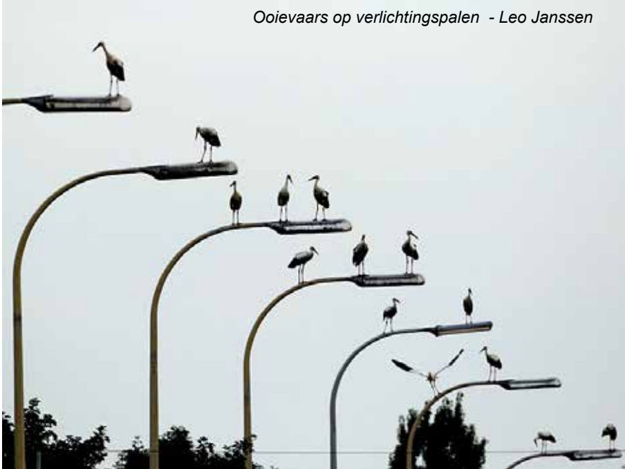
Ooievaars op verlichtingspalen - Leo Janssen

Boomsesteenweg, Wilrijk overvloedig naar Zuid.