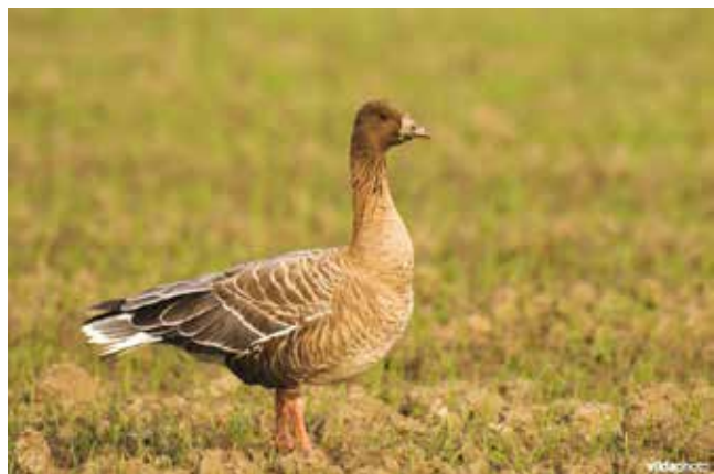
Kleine rietgans

Contactpersoon: Joris Van Reusel 0486 /83 62 34 / info@jupiter24.be