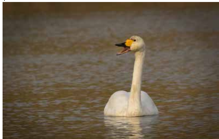
Kleine zwaan