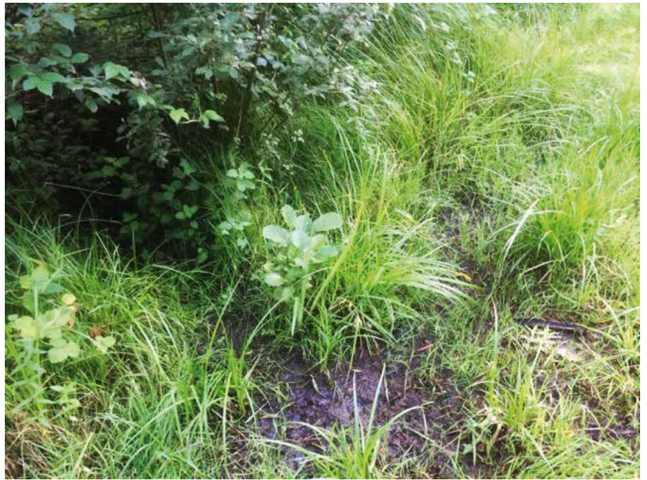
Wissel van de vos langsheen het wandelpad