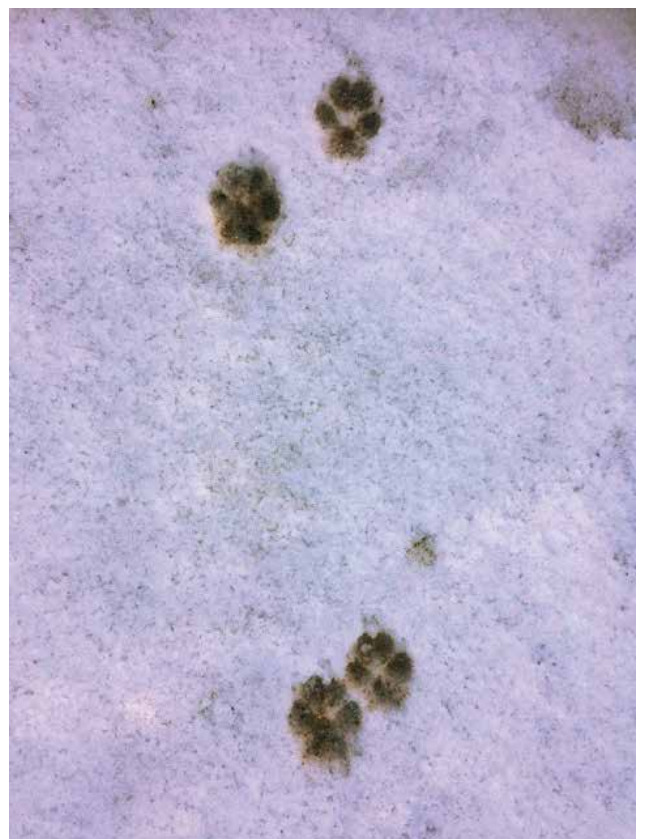
Vossenprenten in de sneeuw

De rekel licht een achterpoot en spuit schuin naar voren ten opzichte van de pootafdrukken. Een moervos hurkt, zodat de urine iets achter de achterpoten terecht. Vossen (en wolven) zetten ook nog een optisch merkteken (een merkteken op zicht) uit, door hun uitwerpselen op een goed zichtbare plaats uit te stallen. Deze uitwerpselen worden namelijk vaak op boomstronken, vlakke wandelpaden, stobben, stenen, houtstapels of andere hoge plekken gedeponeerd. Door de uitwerpselen op een verhoging te deponeren, zijn ze niet alleen goed zichtbaar, maar worden de geuren