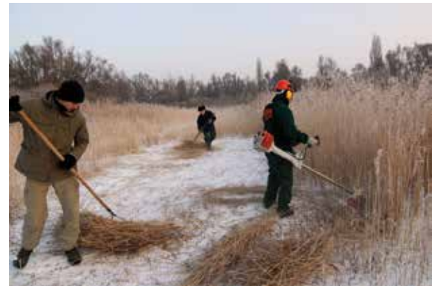
Winterbeheer in de Polder