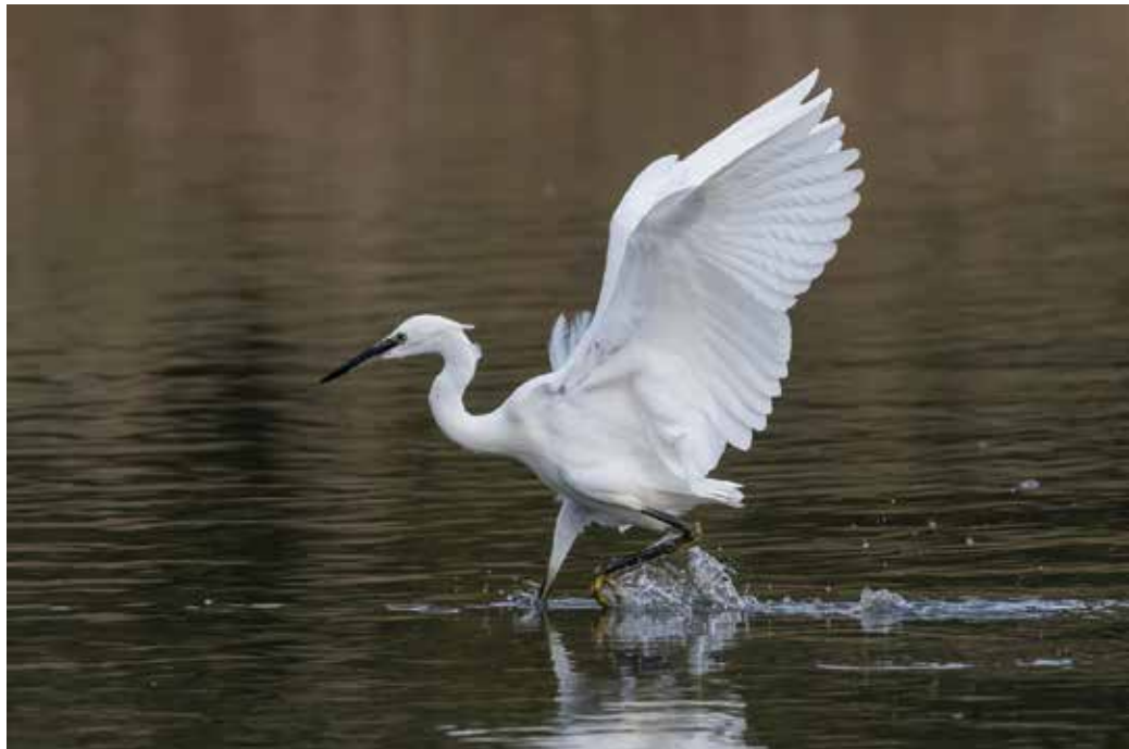
Kleine zilverreiger - Foto: Luc Peeters

De lage waterstand en het nieuw uitgegraven noordelijk deel in het Broekskot/Hobokense Polder trok