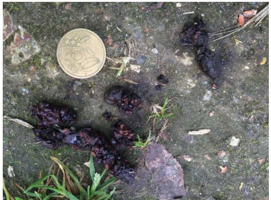
Faeces van vos met bramen

In het territorium bewegen de dieren zich niet willekeurig, maar volgen zij vaste paden, die na enige tijd natuurlijk worden platgelopen. De paden die op die manier door roofdieren worden gevormd, worden "wissels" genoemd. Bij nauwkeurige waarneming kan men op zachte grond in deze paden de prenten en meestal ook de uitwerpselen vinden.