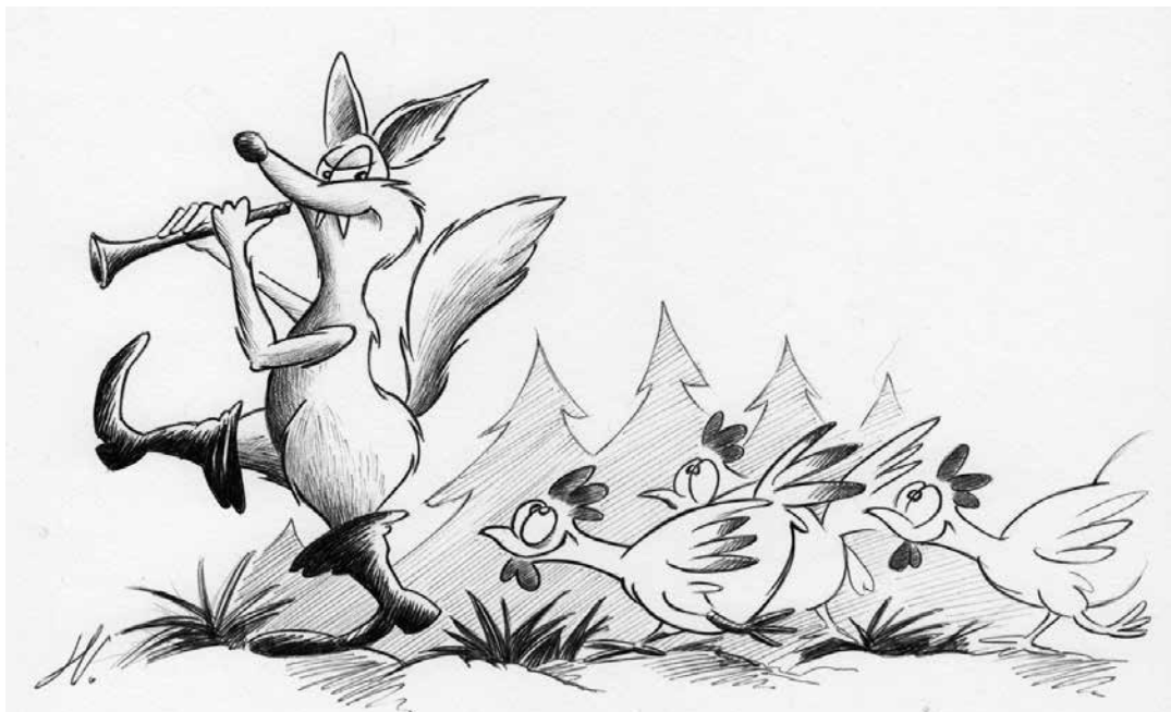
Tekening: Herbert Vandeloop