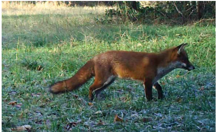
De oorschelpen worden gericht naar de oorsprong van het geluid