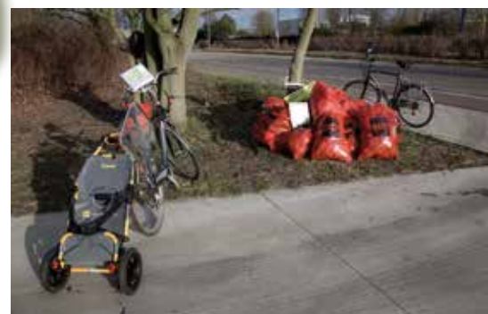
Resultaat van een opruimbeurt

aan op de parking van United Caps, Schroeilaan 15 Hoboken. Wij zorgen voor vuilzakken en grijpstokken. Meebrengen: werkhandschoenen, gesloten schoeisel (of laarzen) Einde voorzien omstreeks 12 u na een heerlijk gratis drankje !!!!