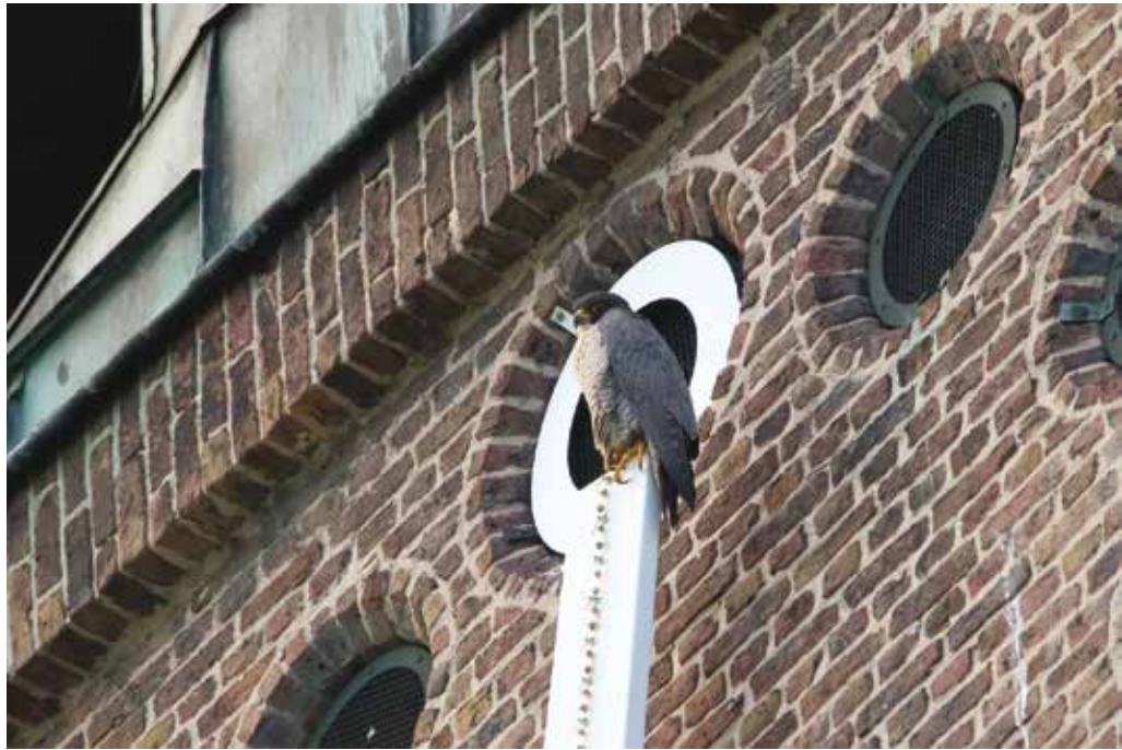
Slechtvalk op de Kristus Koningkerk

Tussendoor dobberden we met zo'n 40 liefhebbers een dagje op de Noord-