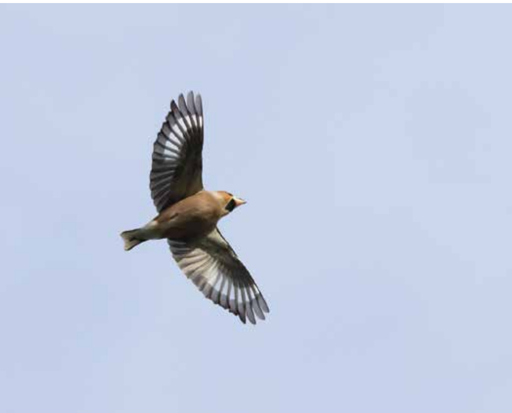
Appelvink - Foto: Maarten Mortier