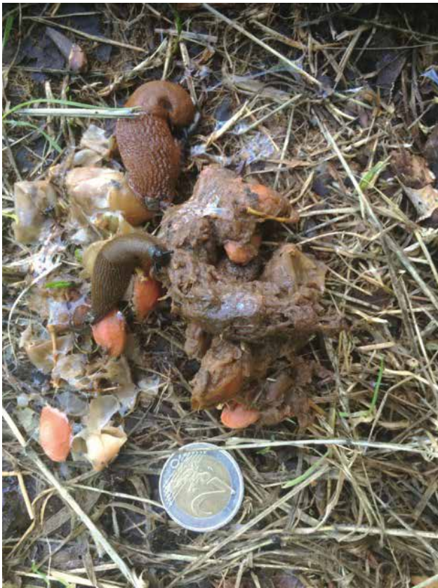
Faeces van vos met pruimen (hopelijk heeft hij er konijn bij gegeten)

door de wind beter verspreid. De geur van deze uitwerpselen speelt bij vossen een rol bij het afbakenen van het territorium. Ze hebben daarvoor binnen de anus speciale geurklieren die de geur aan de ontlasting meegeven, vooral ook in de bronstperiode. Door de uitscheidingen van de anale klieren krijgen de uitwerpselen die typische vossengeur. Ook de kleurloze urine van de vos, die men ook wel "pekel" noemt, vormt een zeer krachtig geursignaal. Deze is ook voor de mens waarneembaar. Boven de staartwortel bevindt zich eveneens een klier. De afscheiding hiervan verspreidt een viooltjesgeur en wordt daarom de "viooltjesklier" genoemd.