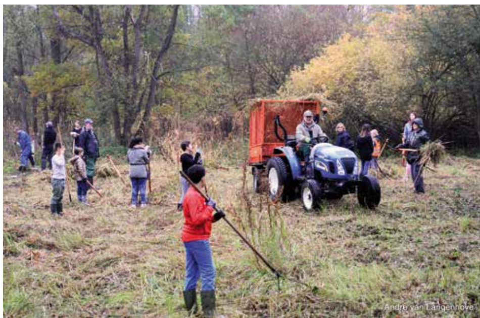
Natuurbeheer met schoolklassen

Er is heel wat werk gepresteerd en de Goudklompjes zijn altijd blij dat ze hierbij geholpen worden door al die schoolkinderen. Bedankt daarvoor! Peter