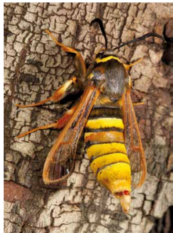
Wespvlinder ( S. bembeciformis )

leer, een gevarieerd landschap van natte wei- en hooilanden, grachten