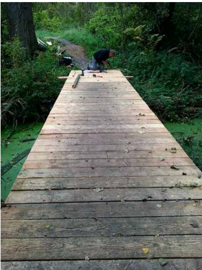
Brug over de Leigracht

Eind september en begin oktober krijgen heel wat graslanden een tweede maaibeurt om kort de winter in te