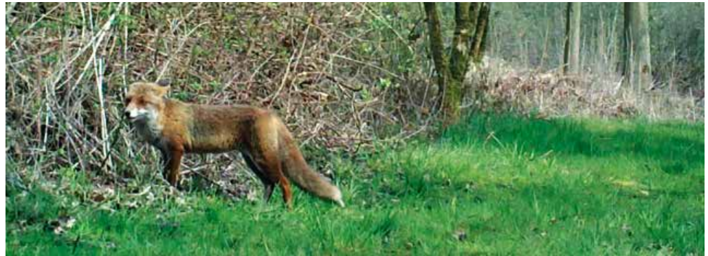
Rekel op zoek naar insecten

Spitsmuizen laat hij meestal links liggen, omdat er bij deze insecteneters een licht giftige stof in het speeksel steekt. Hij sprint konijnen achterna