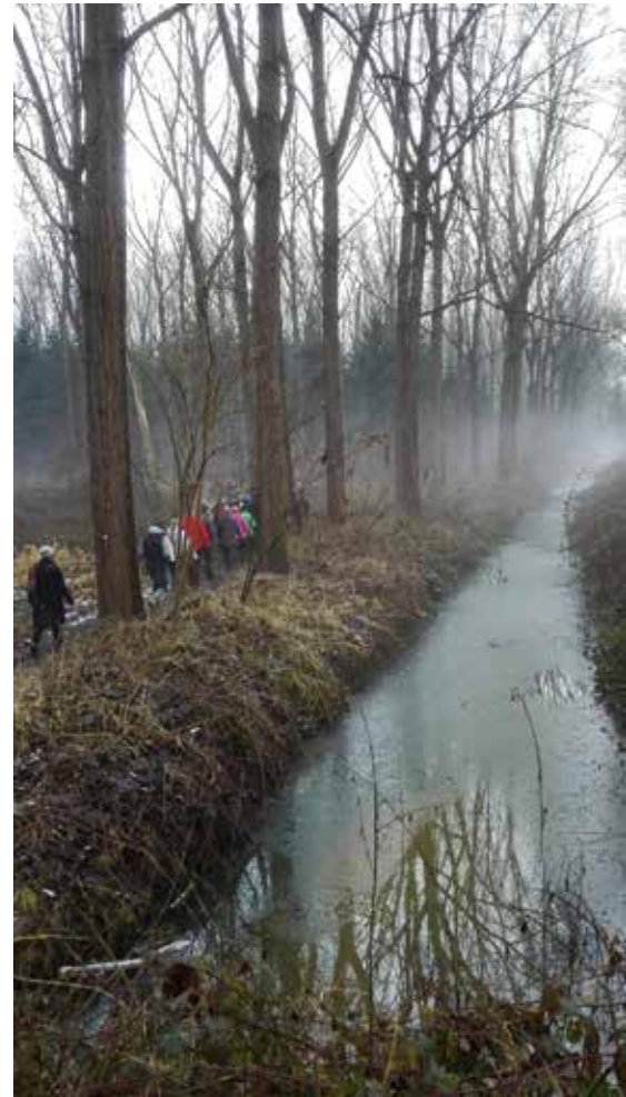
Nieuwjaarswandeling in de Polder

Praktisch: Afspraak om 8.30 u op de parking aan 't Spant, onder viaduct, Boomsesteenweg 335 Wilrijk. Einde ter plaatse rond 17 u. Mee te brengen: picknick, kijker, telescoop, vogelgids, fototoestel, stevig schoeisel en bij regenweer laarzen.