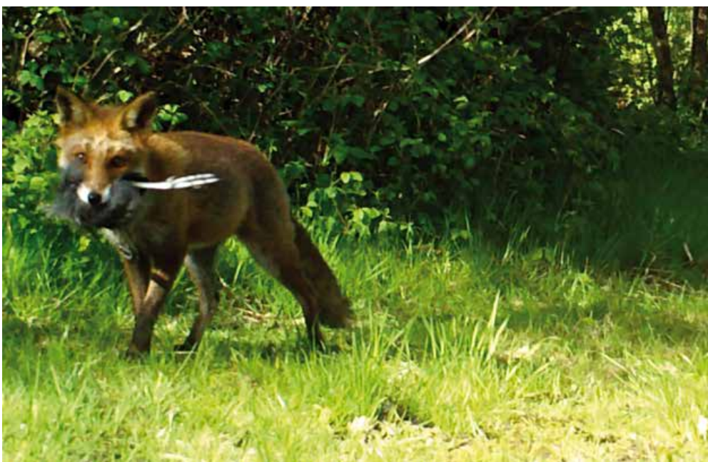
Rekel met gevangen meerkoet

Het aandeel ongewervelden maakt volgens het onderzoek