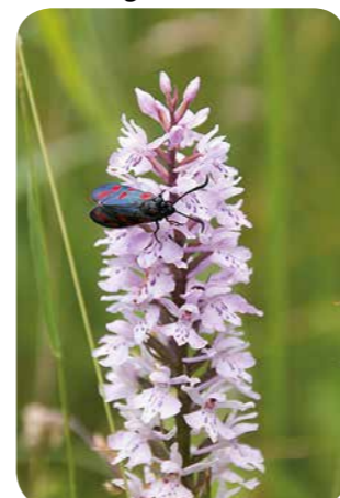
Sint-Jansvlinder op bosorchis

Opvallend in een bloemrijk grasland zijn de bloeiende orchideeën. Vele soorten zijn in de twintigste eeuw achteruitgegaan. Waar eertijds vele graslanden in mei en juni gekleurd waren door orchideeën, zijn ze nu vaak beperkt tot natuurgebieden. Een soort