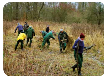
Onze Goudklompjes aan het werk

De natuur rekt op een groep vrijwilligers en professionele medewerkers van Natuurpunt die het gebied beheren. In het grootste deel van de Hobokense Polder mag de natuur haar gang gaan. Dit is vooral waar je bos en struweel vindt. De gras- en rietlanden worden wel beheerd om te vermijden dat alles evolueert naar bos.