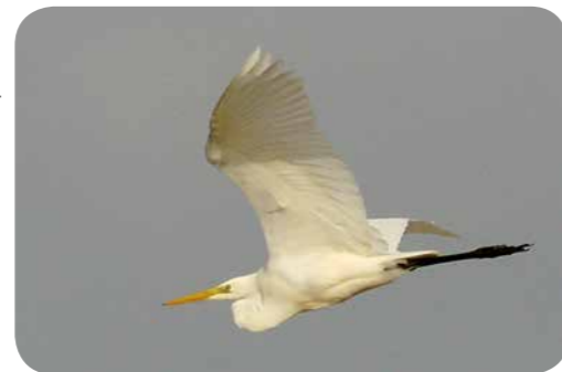
Grote zilverreiger vliegt over de trektelpost van vogelwerkgroep ARDEA op de Scheldejijk

Gelegen in een stedelijke omgeving vervult de Hobokense Polder een functie als groene long en tuin voor de stad. Dankzij de beheeroverkomst met de stad Antwerpen kon Natuurpunt de Hobokense Polder verder uitbouwen tot een gebied waar iedereen welkom is.