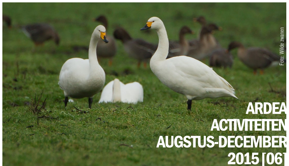
Foto: Wilde zwanen

ARDEA ACTIVITEITEN AUGUSTUS-DECEMBER 2015 [06]