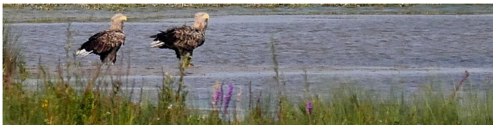
Visarend en zeearenden tijdens de vogel-verrassingstocht van 2014