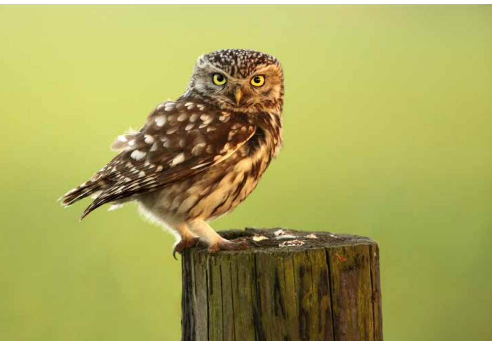
Steenuil - Foto: Glenn Vermeersch

Ook de laatste (?) boerenzwaluwen en Kieviten in ons werkingsgebied volgen we dit jaar opnieuw. Met de fiets trekken we op 20 mei en 17 juni naar enkele weidegebiedjes en langsheen boerderijen. Hoe gaan de landbouwers hier bij ons in de buurt om met deze vogels? Broeden er weer Kieviten op de snelwegberm, en op de golfterreinen? En wat met de