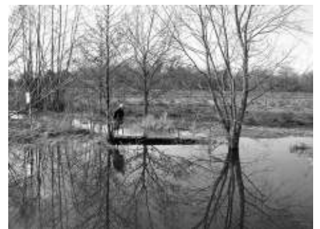
Droge en natte plekken in het Mechels Broek