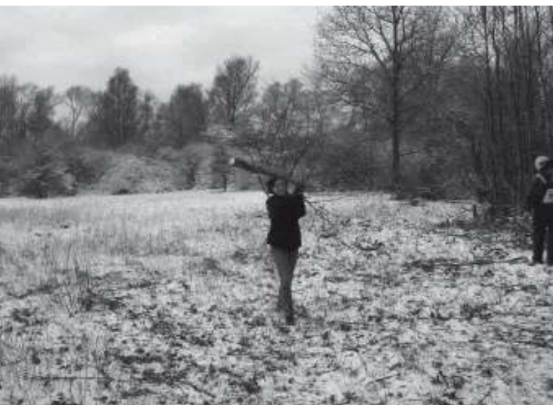
De dames doen niet onder

Wat kan een actief pensioen goed doen, mannen !