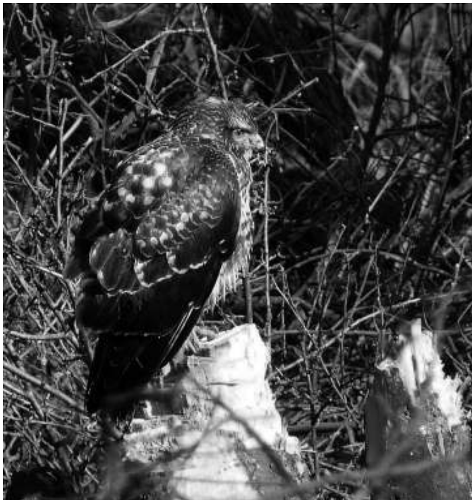
Buizerd in de Hobokense Polder

vogel, koperwiek en sijs waren overall aanwezig: in de Polder, Fort 8, de parken, biotuin, waterzuiveringstation ... (AD, AVL, GB, ID, JP, JR, SB, WDR).