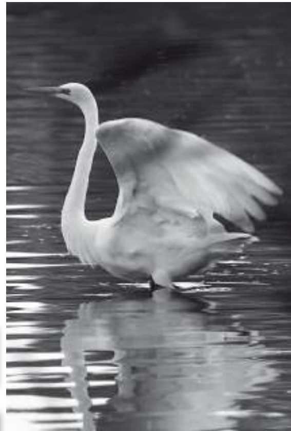
Grote zilverreiger