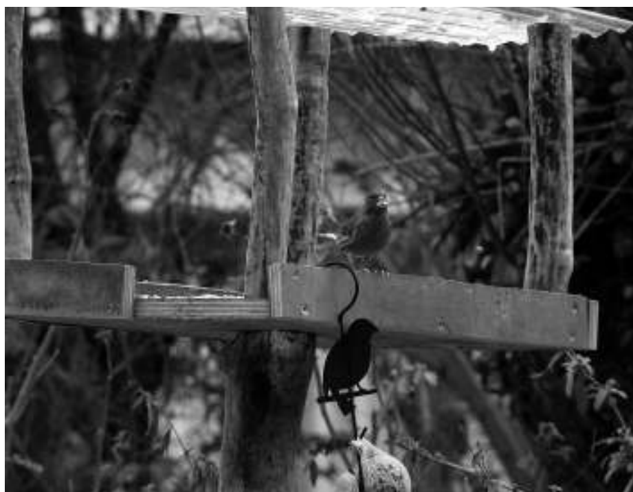
"Mystery bird"