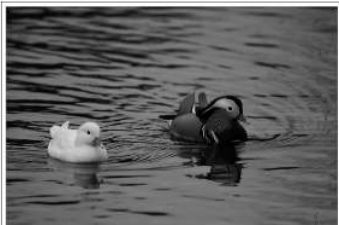
Mandarijneenden - Foto: Wim Dekelver