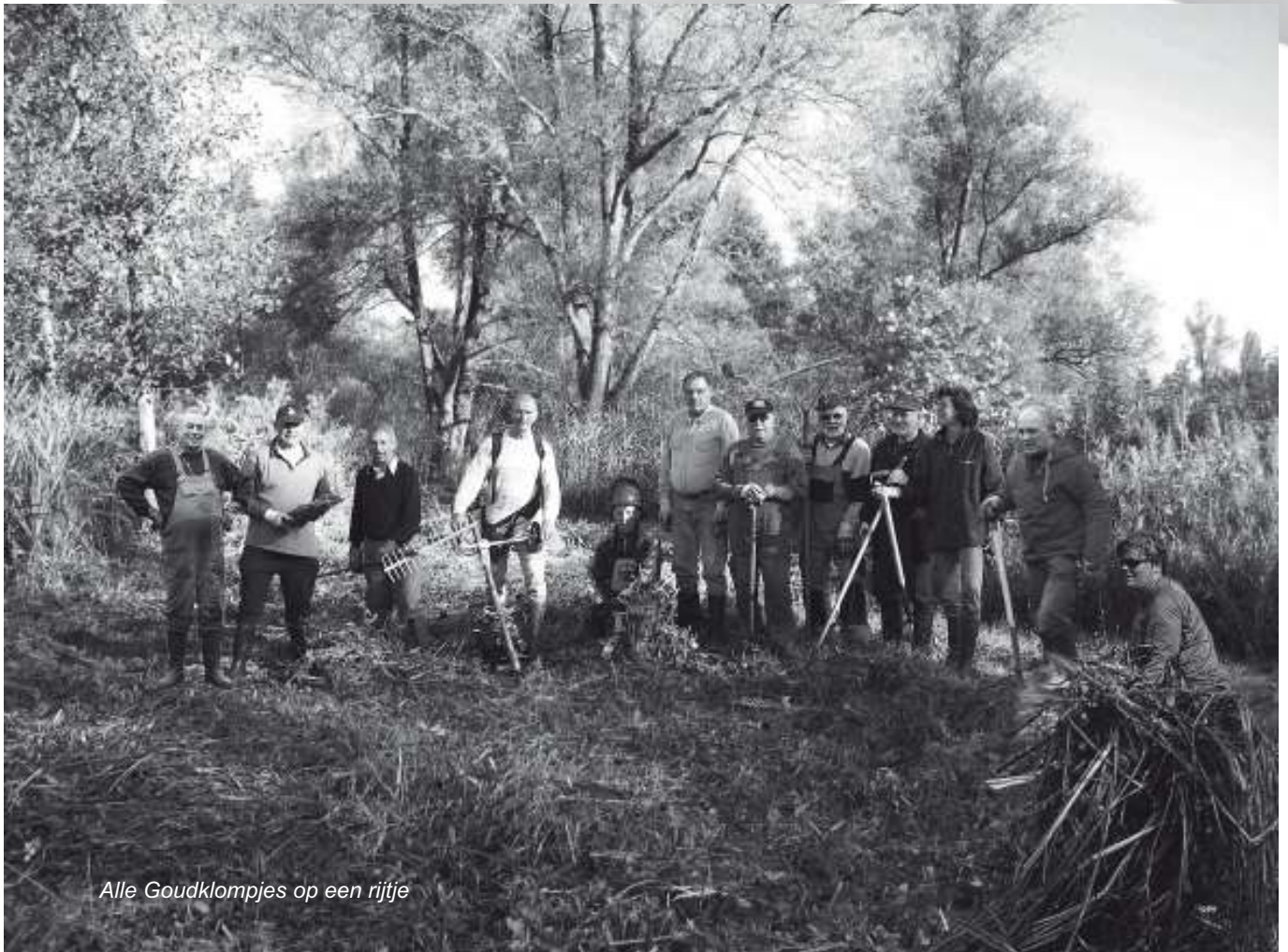
Alle Goudklompjes op een rijtje