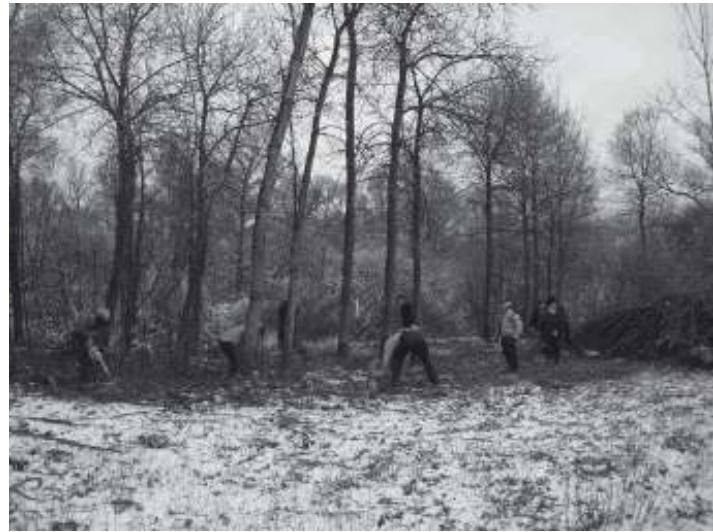
Terug in actie na de pauze

Het valt iedereen op dat onze jongere van de Passage vandaag in vorm is. Met de handzaag in aanslag molt hij menig boompje, hij heeft er duidelijk zin in.