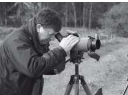
Luc actief op de Scheldedijk

Een prachtig moment om kennis te maken met de eerste voorjaarsbloeiërs. Zij tooien de Hobokense Polder in een zacht kleurenpalet. Ook de