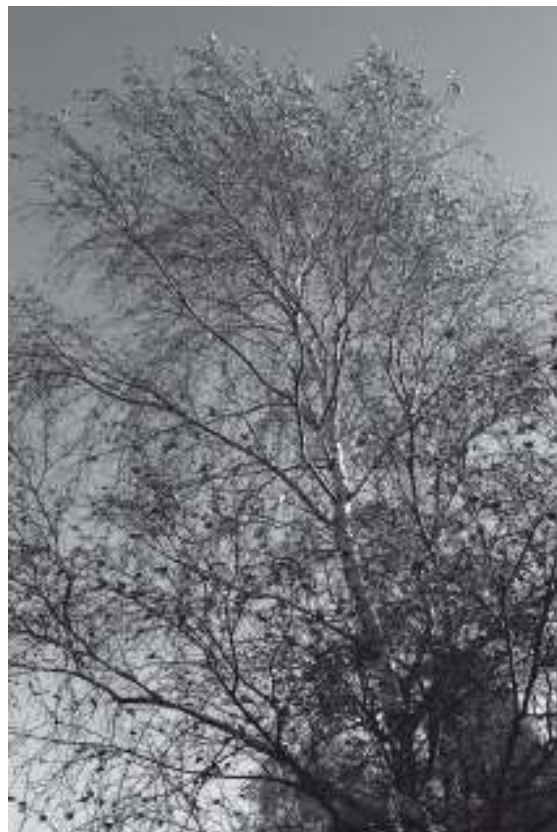
Berkenboom in lentetooi

Het gebied is een complex van ontzilte schorren met aangrenzende voormalige slikken en zandplaten. Het heeft zijn huidige hoedanigheid gekregen nadat in 1987 de Philipsdam was aangelegd. Het gebied is nog steeds sterk in ontwikkeling. Het bestaat uit een parkachtig landschap, waarin bosschages en open gedeelten elkaar afwisselen. De vari-