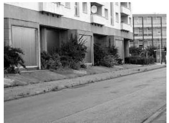
De nestkasten aan de Langblokken op de Luchtbal.

reeds gierzwaluwen tot broeden kwamen. Naast de gierzwaluw profiteerde de huismus mee van deze nestkastactie want in 43 nestkasten was een broedgeval van huismus aanwezig. In totaal waren dus bijna de helft van alle nestkasten bezet. Het gedetailleerd rapport van deze inventarisatie is terug te vinden op de site van de vogelwerkgroep www. antwerpen-noord.be/vogelwerkgroep onder soortbescherming.