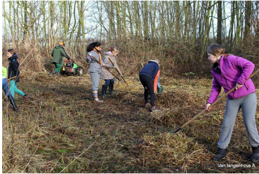
Van langenhove A

Na een verdiende pauze nog wat ruimen, harken en afvoeren en klaar was kees. De SIBSO jongeren werden terug naar de bushalte gebracht,