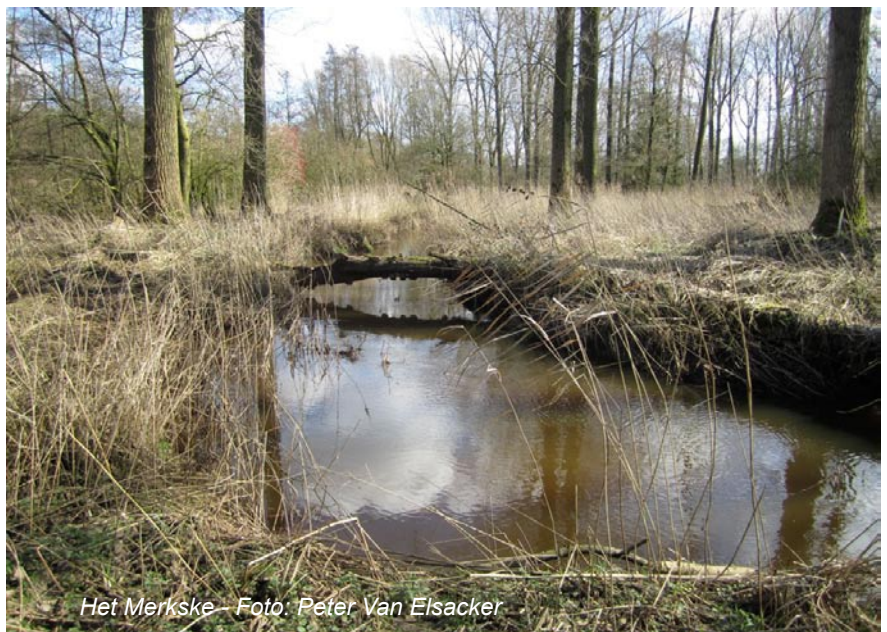
Het Merkske

En kijk zeker ook op onze eigen site: www.hobokensepolder.be > Natuurgebieden > Hobokense Polder.