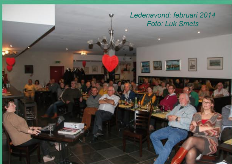
Ledenavond: februari 2014