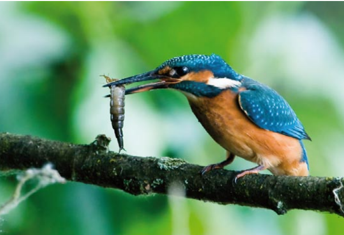
Ijsvogel met "maaltijd"