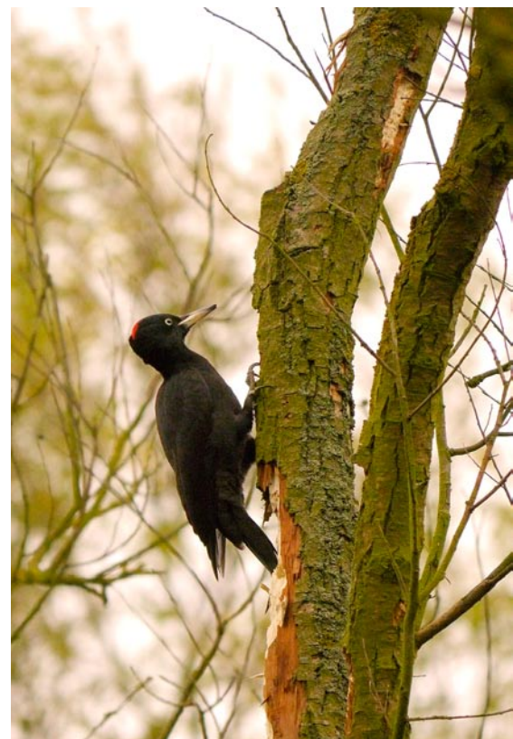
Zwarte specht - Foto: Guy Borremans