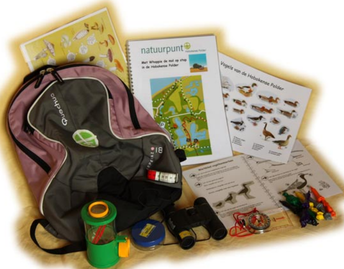
De Whoppie-doe-rugzak