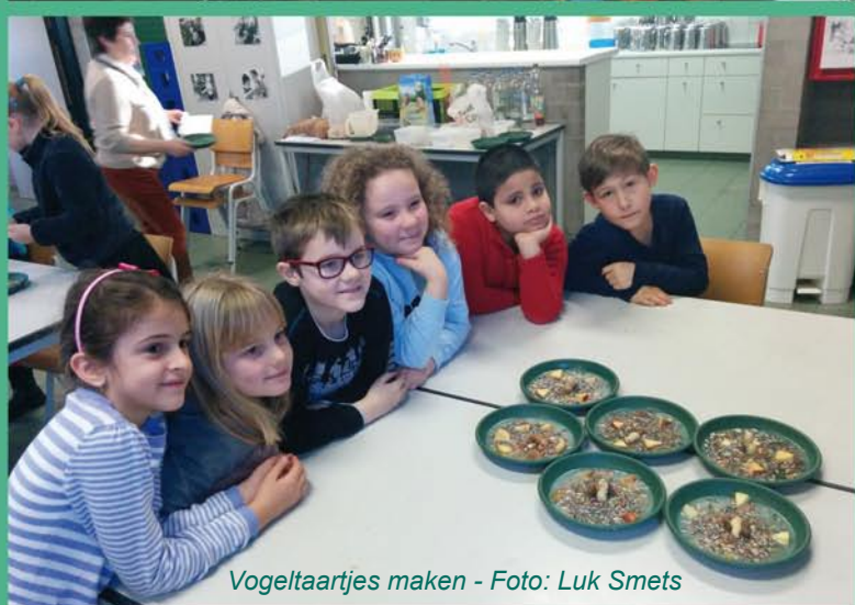
Vogeltaartjes maken