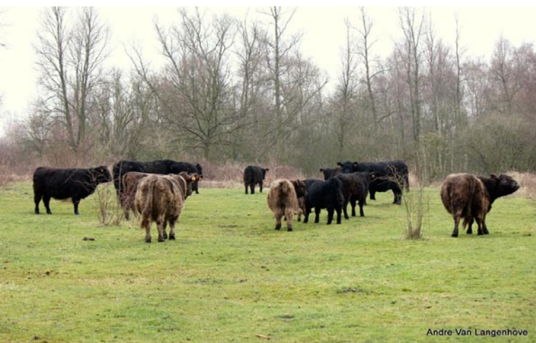
André Van Langenhove

Beheer, het woord is gevallen, dat is op zich geen spontane gebeurtenis. Een doelstelling van beheer is het creëren, herstellen of in stand houden van geschikte omstandigheden waarin de natuur zich verder spontaan kan ontwikkelen. Dat kunnen drastische ingrepen zijn om een cultuurlandschap (akker, weide, intensief uitgebate landbouwgrond, ...) terug om te zetten naar het vroeger historische landschap: echt natuurherstel dus. Historische bronnen kunnen hierover nuttige informatie geven: de Ferrariskaarten uit de 18de eeuw (Ferraris was een