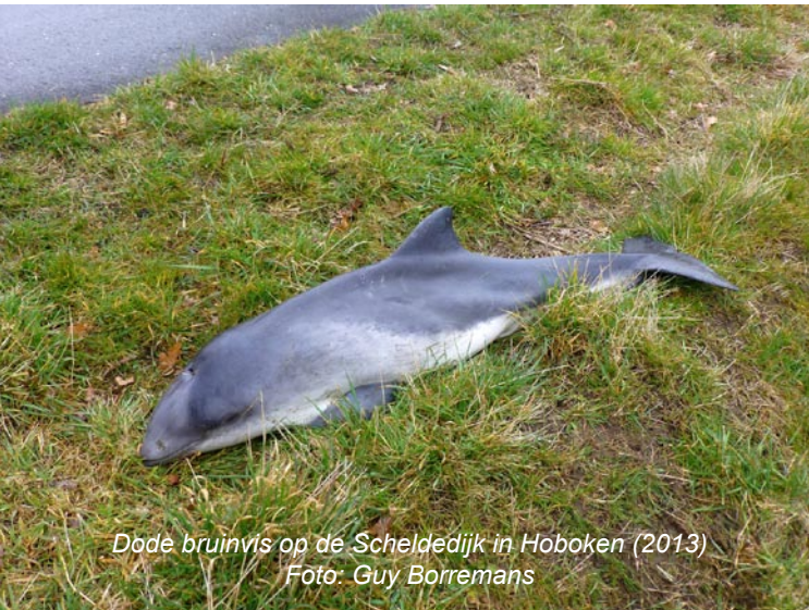
Dode bruinvis op de Scheldebijk in Hoboken (2013)

Tijdens het voorjaar van 2013 werden we geconfronteerd met een voor Vlaanderen ongekend natuurfenomeen. In maart, april en mei werden 'massaal' veel bruinvissen, onze kleinste dolfinachtige, op de Schelde en de Rupel waargenomen. Op de website www.waarnemingen.be werden 150 waarnemingen ingevoerd op deze rivieren in 2013. Van 2008 tot 2012 werden er alles samen slechts 6 waarnemingen doorgegeven.