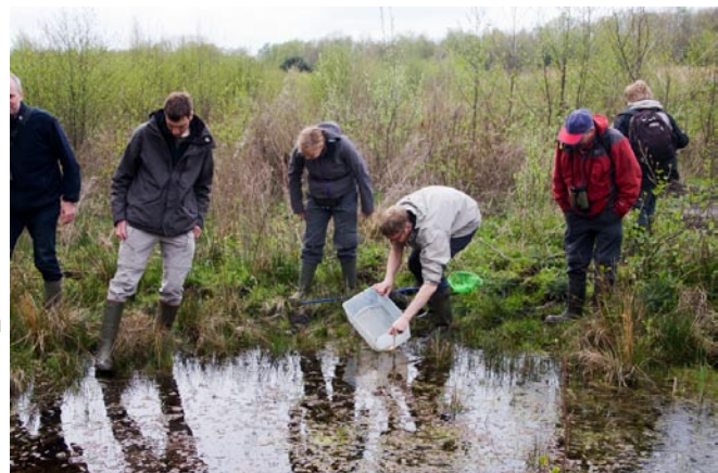
Waterdierpjes zoeken

Deze doe-activiteit is heel boeiend voor het hele gezin, ook met kleuters. Afspraak om 14 u op de parking op de Schroeiiaan (nabij station Hoboken Polder), Hoboken. Einde omstreeks 16 u. Meebrengen: laarzen, muggenmelk