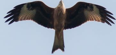
Rode wouw

Campus 3-Eiken Wilrijk (LJ, JH, PVW, MVR, BM, JC, LVS, JP en WM). Tussen 27/9 en 28/1 werd 11x een slechtvalk waargenomen over de Schelde te Hoboken, Middelheim/Antwerpen, Edegem en Hove. Het betrof vermoedelijk telkens een plaatselijke vogel, behalve die welke op 27/9 hoog over HP, kilometers lang pal west doorvloog.