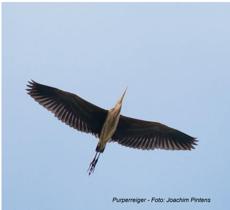
Purperreiger - Foto: Joachim Pintens

Zittende en foegarerende vogels waren te zien in HP met max 5 ex die neerstreken op 19/10 (JC, LVS) en 1 vogel op Fort VI op 12/12 (PH). Op 21/9 vloog vanuit Kruibeekse Polder een juveniele purperreiger over te