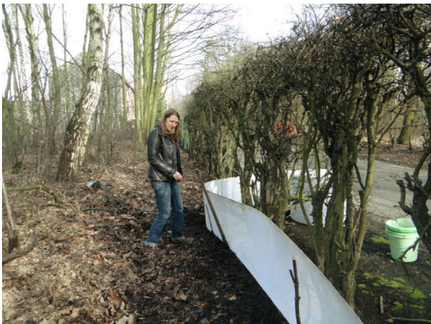
In februari werd het paddenscherm geplaatst in de Schansstraat nabij Fort 8