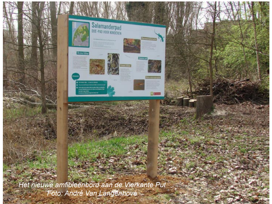
Het nieuwe amfibieën bord aan de Vierkante Put

1) een schitterend amfibieën bord met onze vijf amfibieën op, is deze week geplaatst nabij de vijver. De bruine kikker, de groene kikker, de gewone pad, de kleine watersalamander en de Alpenwatersalamander worden voorgesteld ... en bovendien met enkele leuke doe-opdrachten voor kinderen.