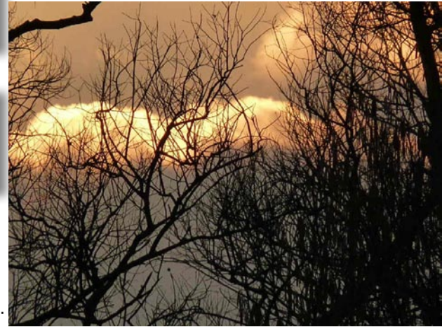
Schemering in de Hobokense Polder

Afspraak om 20 u op de Schroeilaan (parkeerstroken nabij station). Meebrengen: laarzen, verrekijker, vogelgids en muggenmelk !!!!!