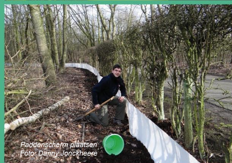
Paddenscherm plaatsen