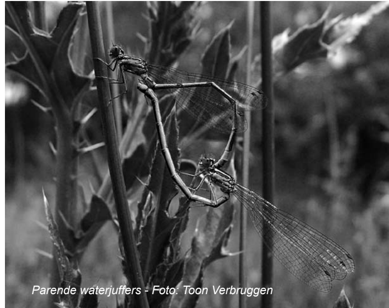
Parende waterjuffers

Voor de tweede praktijkles trekken we naar Herentals, het gebied van de Nete. Op zondag 15 juni vertrekken we omstreeks 13 u en zullen weer thuis zijn omstreeks 18 u.