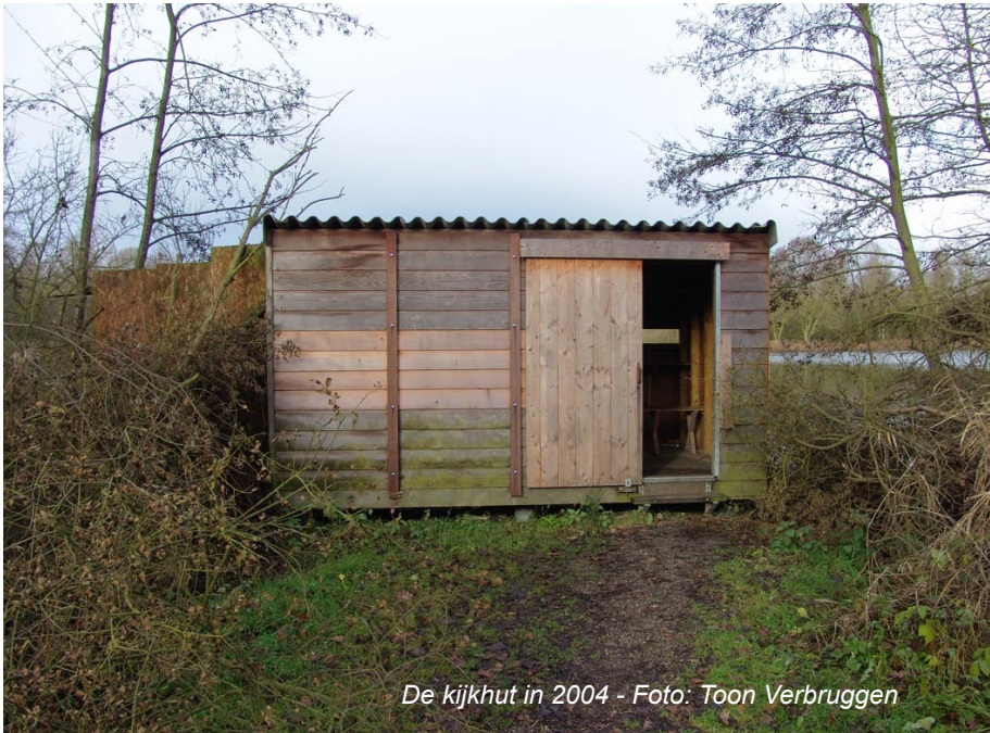
De kijkhut in 2004

hut een geliefkoosd doelwit voor vandalen. Het begon met het vernietigen van de educatieve vogelborden die we, naïef als we waren, in de kijkhut hingen. Het ging verder met het bekladden van de wanden met vunzige grafiek en praat, kleine brandjes, gat in het dak, de deur er uit geschopt... Ooit wist een parkwachter enkele daders te klissen. Nadien ging het een tijdje beter. Ondertussen zijn de parkwachters verdwenen en nieuwe vandalen verschenen. Op 21 december werd de kijkhut tenslotte vak-kundig in de as gelegd, enkel het niet brandbare dak bleef over.