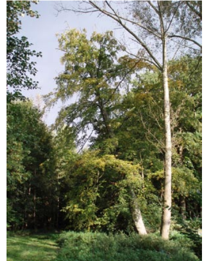
Uilenbos in Hove

De wandeling start om 14 u. De zomervergadering start om 16 u. Info over vertrekplaats en lokatie van de vergadering (zie blog en website)