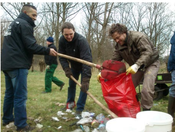
"Zakken vullen" - Foto: Eef Flo

tje van het Hollebeekpark. Om 17 u wordt iedereen daar terug verwacht. Daar kan bij een drankje en hapje nog wat worden nagepraat. Materialen om het vuil te verzamelen (handschoenen, vuilzakken, afvalgrijpers, emmers, kruiwagen) zullen aanwezig zijn, wandelschoenen of beter nog, laarzen zijn aangewezen. Om enig idee te hebben met hoeveel we zullen zijn, vragen we om uw deelname te melden bij de conservator van het gebied, tevens bestuurslid van Natuurpunt Hobokense Polder: dirk.vandorpe@telenet.be , hier kan je ook bijkomende vragen stellen indien je dat wenst. Iedereen van harte welkom. Tot dan!