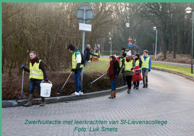
Zwerfvuilactie met leerkrachten van St-Lievenscollege