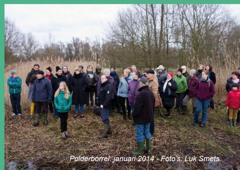
Polderborrel: januari 2014