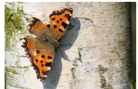
Grote vos - Foto: Jan Rose