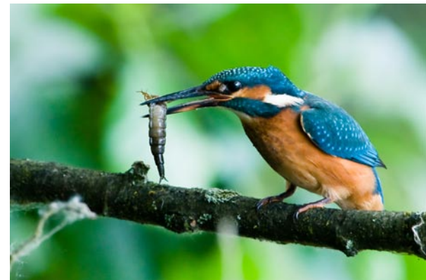
Ijsvogel met prooi

Samenkomst om 13 u op de parking van zwembad Sorgvliedt, Krijgsbaan in Hoboken. Terug: omstreeks 17.30 u. Goede wandelschoenen, verrekijker, muggenmelk, bij heet weer: zonnepet en drankje voor onderweg. De wandeling is gratis, maar wel kostendelend samenrijden: 7 eurocent/km te betalen aan de chauffeur (= ca. 3 euro)