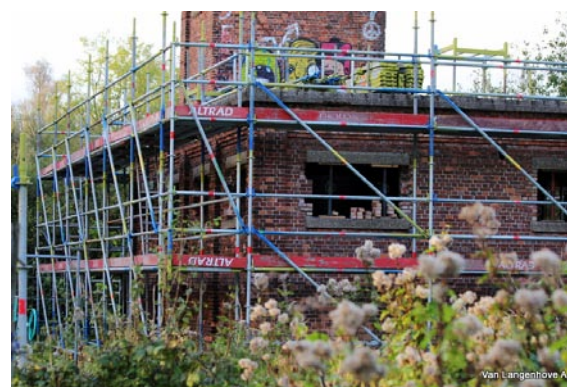
Aciérie in de steigers: een beeld uit het recente verleden