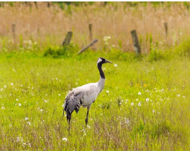
Kraanvogel - Foto: Guy Borremans

Je bent pas ingeschreven na stor- ting van het voorschot van 50 euro p.p. op rekening BE81 5230 8065 0424 van Natuurpunt Hobo- kense Polder, met referentie: Oost- kantons + het aantal personen. Het saldo wordt tegen 1 oktober betaald. De deelnemers ontvangen later de nodige info.