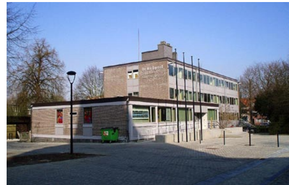
CC De Markgraaf - Hove