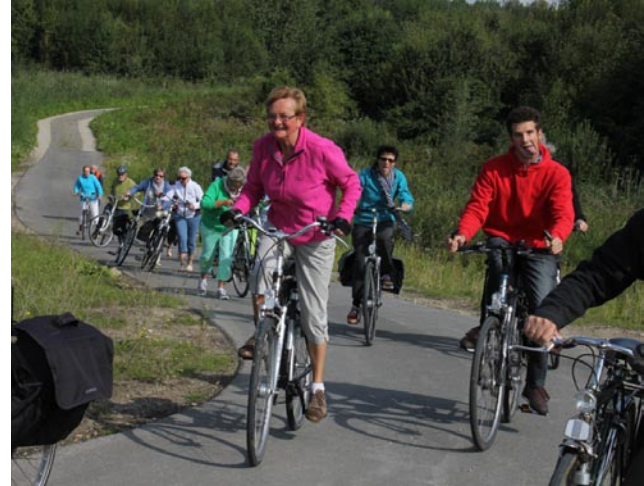
Steile helling ... duwen of afstappen?

Om alles in goede banen te leiden vragen we u om in te schrijven voor deze activiteit. Liefst via de website: http://wijvandepolder.be/goudklompjes/documents/fietstocht/programmas/inschrijven.php of telefonisch aan André of Paul. Wij verwachten u!