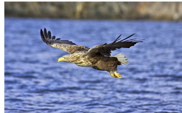
De ster van De Biesbosch: de zeearend