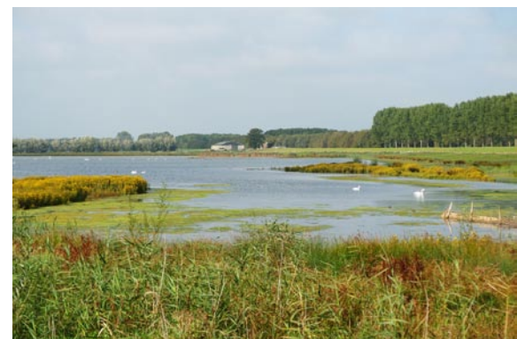
De Tongplaat