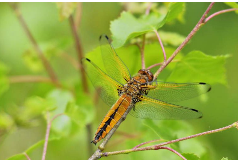
Bruine korenbout