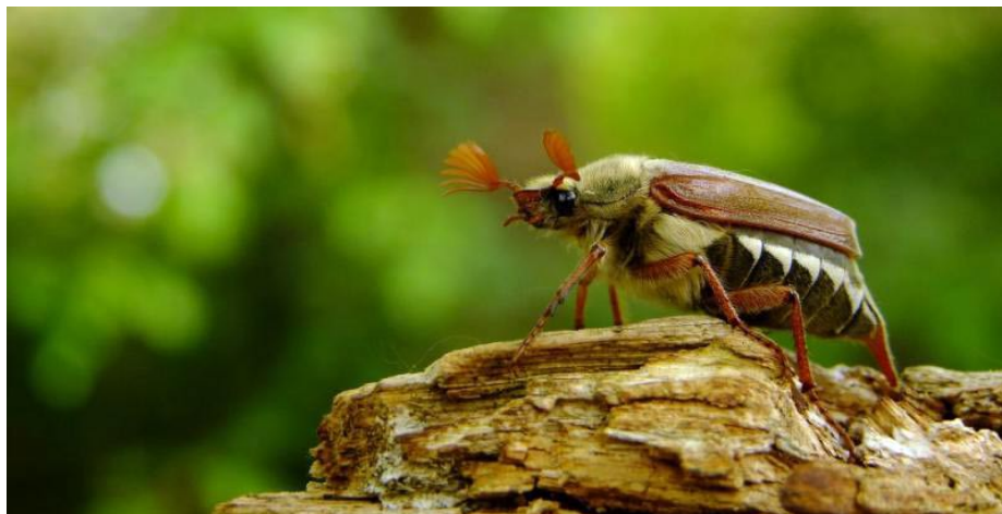
Meikever