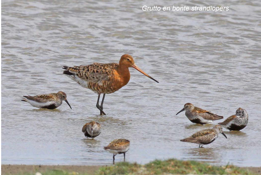
Grutto en bonte strandlopers

vogel over de Vuile Plas op de grens Edegem-Kontich (LS).