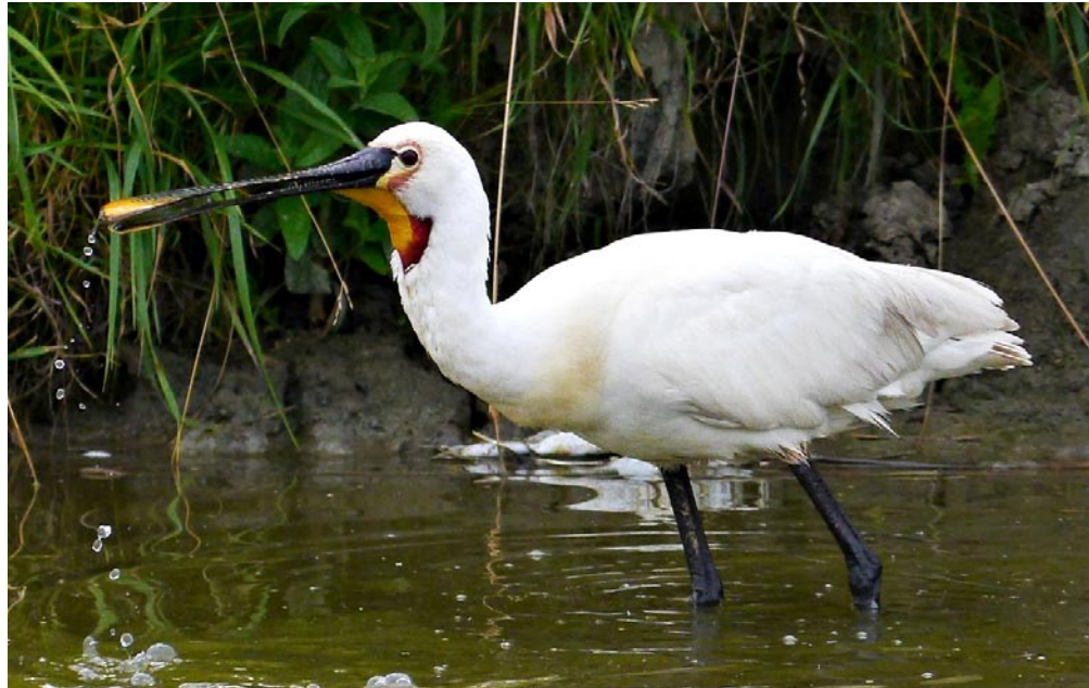
Lepelaar met krop

Er werden in totaal 9 kleine zilverreigers waargenomen waarvan 2 ex overvliegend in Aartselaar op 28/12 (BDS) en 7 ex in april met uitsluitend overvliegende vogels langs de Hobokense Polder of Schelde Hoboken/