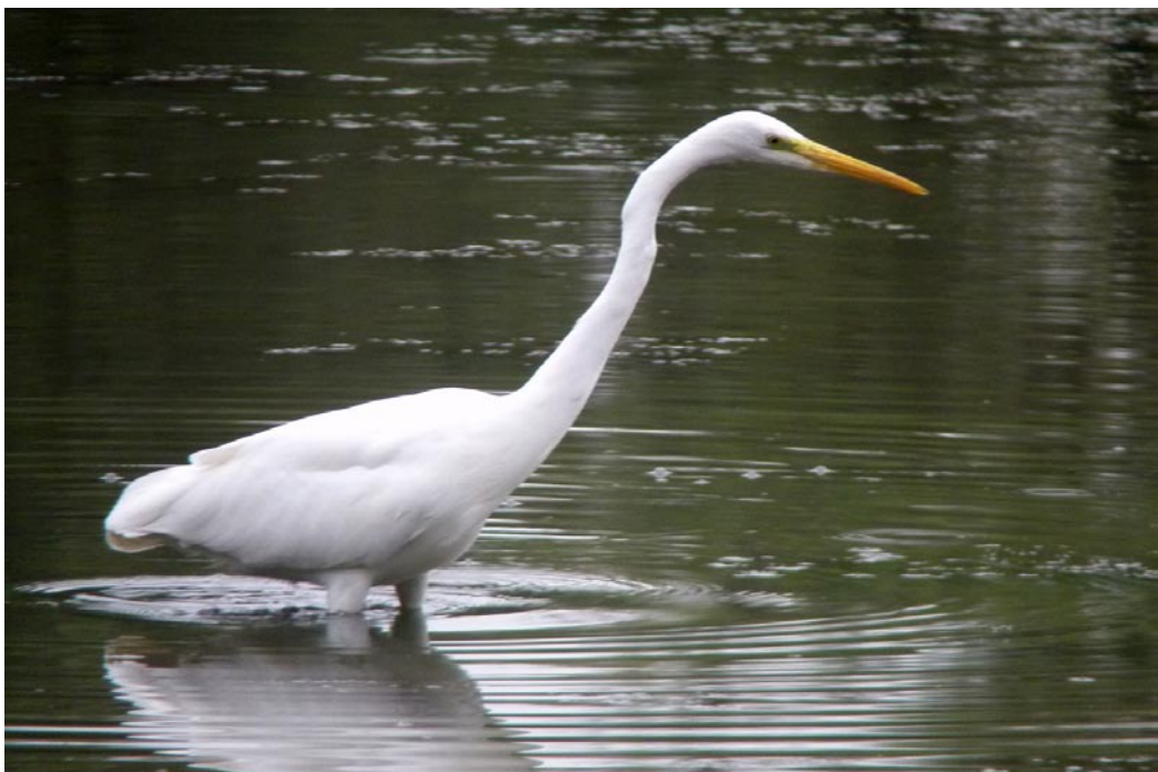
Grote zilverreiger

Op 29/12 vloog een groep van 30 toendrarietganzen in NW richting over de Hobokense Polder (JP).