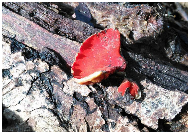
Rode kelkzwam