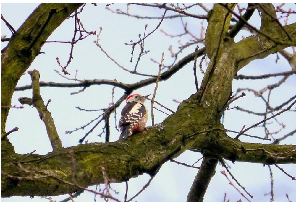
Middelste bonte specht - Foto: Jan Rose

Op 8/11 werd een 1ste jaars mannetje bonte tapuit ontdekt nabij de trektelpost Zigeuner te Mortsels door Stijn Baeten en Pieter Vervloet. Tot 16/11 werd de vogel ter plaatse door talloze waarnemers uit binnen- en buitenland waargenomen en gefotografeerd. Alhoewel deze waarneming net buiten het werkingsgebied van ARDEA valt, vermelden we deze omwille van zijn zeldzaamheid (= de