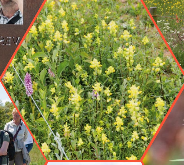
VESTING T GANNETRUH