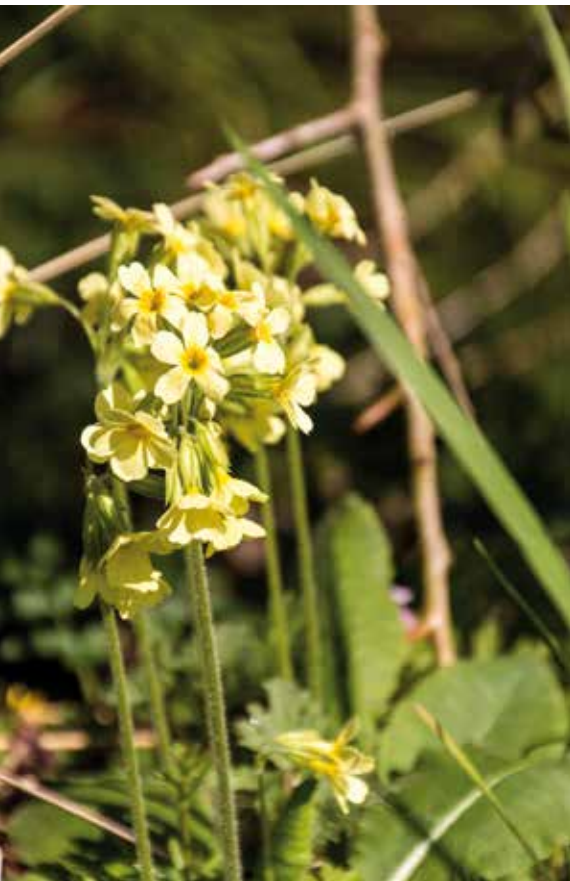
Slanke sleutelbloem