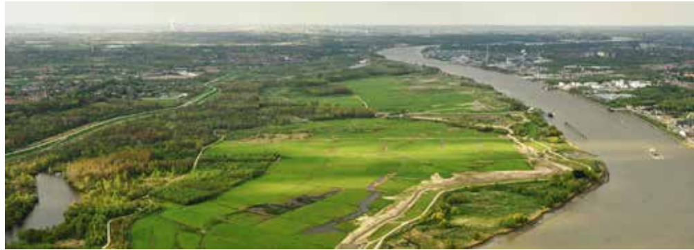
De Polders van Kruibeke en de Schelde, een prachtig (nieuw) natuurgebied aan de overzijde van de Schelde.

Meebrengen: gepaste kledij, verrekijker (telescoop), camera, vogelgids, schetsgerief, dekentje, lunchpakket. Fietsers: pomp en reparatiekit.