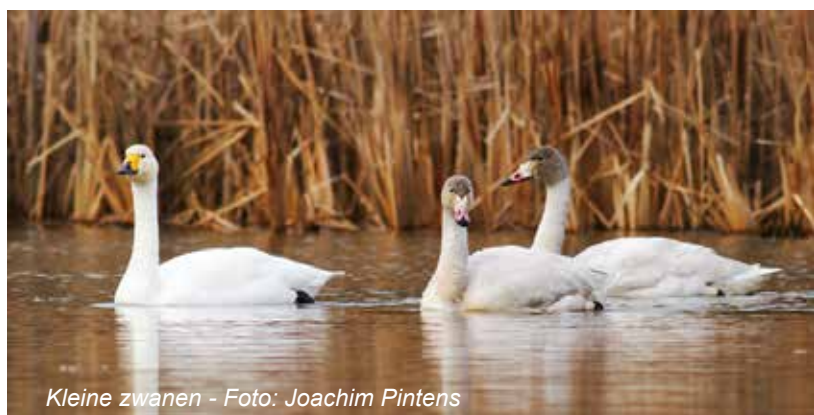
Kleine zwanen

Doordat er naast de rondvliegende waterpiepers maar een deel van de invallende vogels werden waargenomen was het moeilijk om een juist aantal vast te stellen. Het gaat vrijwel zeker om min. 65 vogels, maar mogelijk waren het er meer. Tot en met de winter 2012-2013 leek het erop dat het Groot Rietveld, bij gebrek aan tellingen elders, de enige slaapplaats was binnen de Hobokense Polder met nog 77 exx op 13/2/2013. De winter 2013-2014 bracht echter een verschuiving aan het licht. De telling van 29/12 bij de slaapplaats Groot Rietveld leverde 27 waterpiepers op, waarvan er