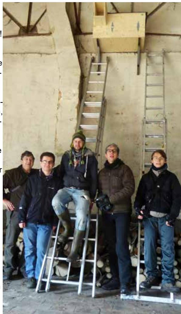
ARDEA plaatste 3 kerkuilkasten