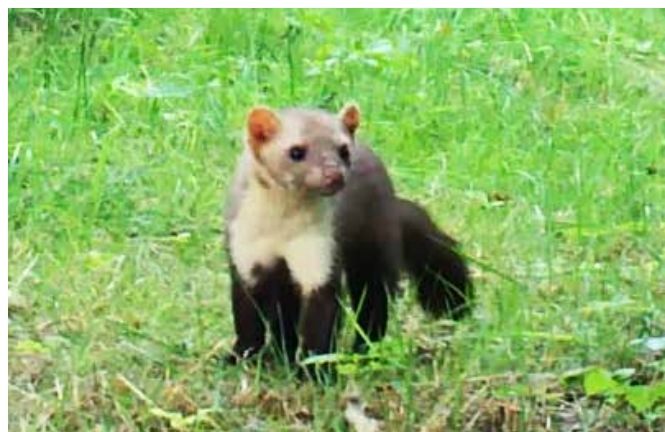
Eén van onze (talrijke) steenmarters op zomerruitstap