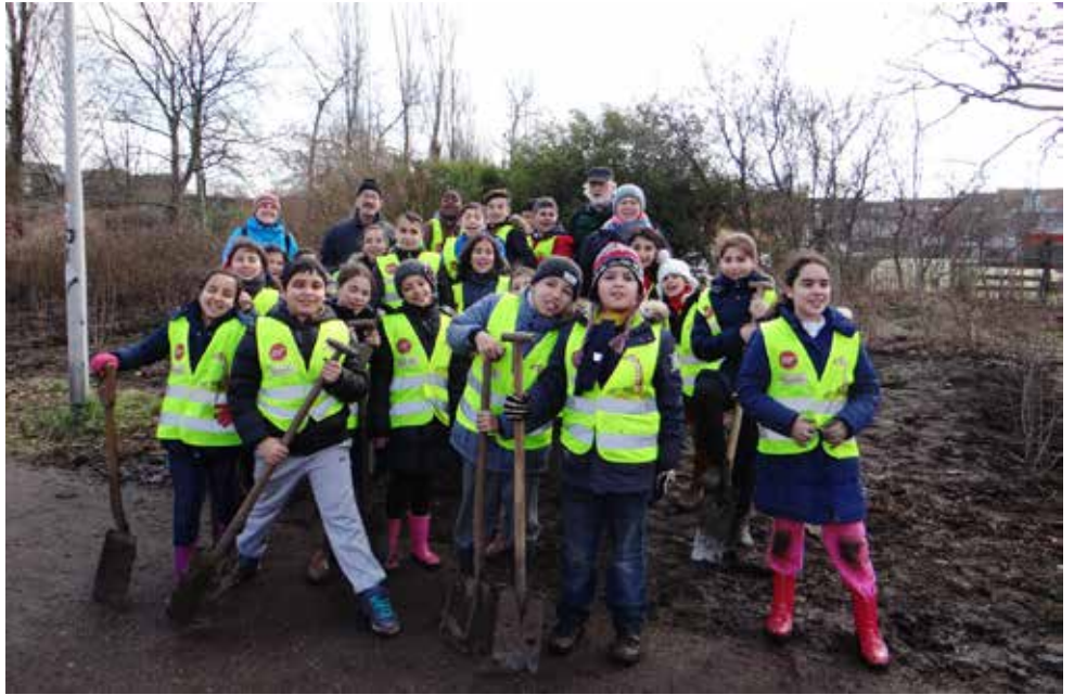
200 m bloesem- en bessenhaag werd aangeplant met IIn van BSGO De Schakel

Maar riet maaien is niet het enige dat er werd gedaan. Her en der werden door de Goudklompjes werken uitgevoerd met de hulp van onze trouwe klasjes.