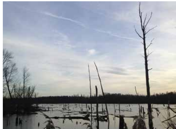
Le Marais d'Harchies, één van Wallonië's beste vogelgebieden

misschien wel het beste vogelgebied van Wallonië, en telt naast tal van zang- en watervogels ook een aalscholverkolonie en enkele reigerachtigen (waaronder de koereiger) onder haar broedvogels. Ook in de herfst en in de winter is het een belangrijk rustgebied