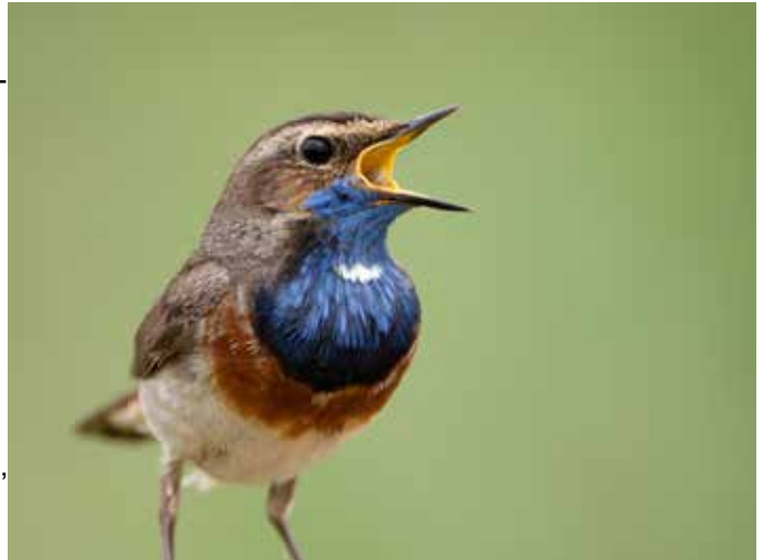
De blauwborst, een broedvogel van de Hobokense Polder

Er wordt meestal in het weekend geïnventariseerd, maar weekdagen kunnen ook gepland worden. Omdat de organisatie in teams van max. 4 à 5 personen met minstens één ervaren vogelkenner nodig is, is aanmelden op voorhand (voor de hele reeks) verplicht. Er worden dan onderling concrete data bepaald in de periode van eind maart tot half juni. Wie ernstige interesse heeft om