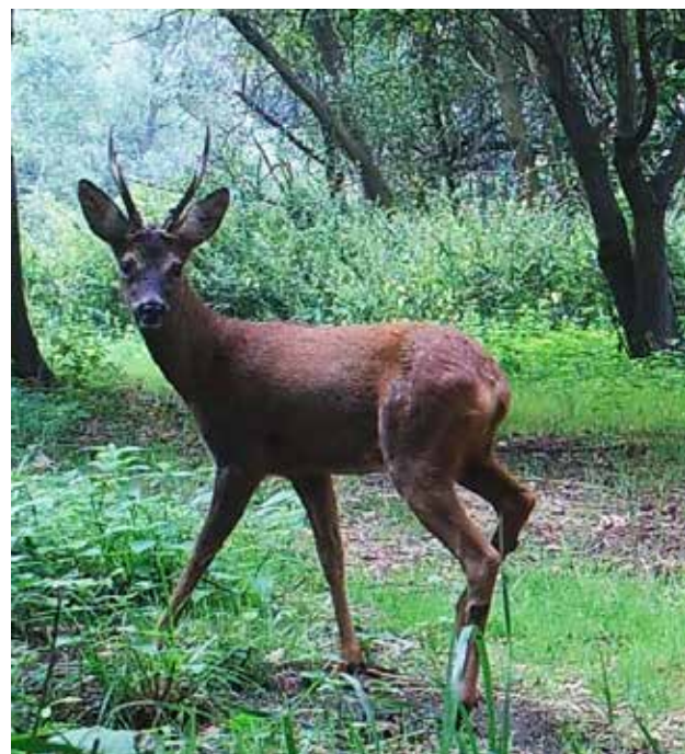
Onze "oude" bok

We hadden al ingeschat dat er minimaal 9 vossen in het gebied zouden rondlopen. Echter bij een telling op basis van herkenbare individuen tijdens de maand augustus werden er met zekerheid al 5 verschillende dieren genoteerd + 3 die niet met zekerheid konden gelinkt worden aan de 5 gekende exemplaren. Als dit andere dieren zouden zijn, betekent dit dat we het aantal al op 8 dieren kunnen brengen op slechts 1 camera locatie ... het is moeilijk in te schatten wat dit betekent voor het geheel van Hobokense Polder, maar