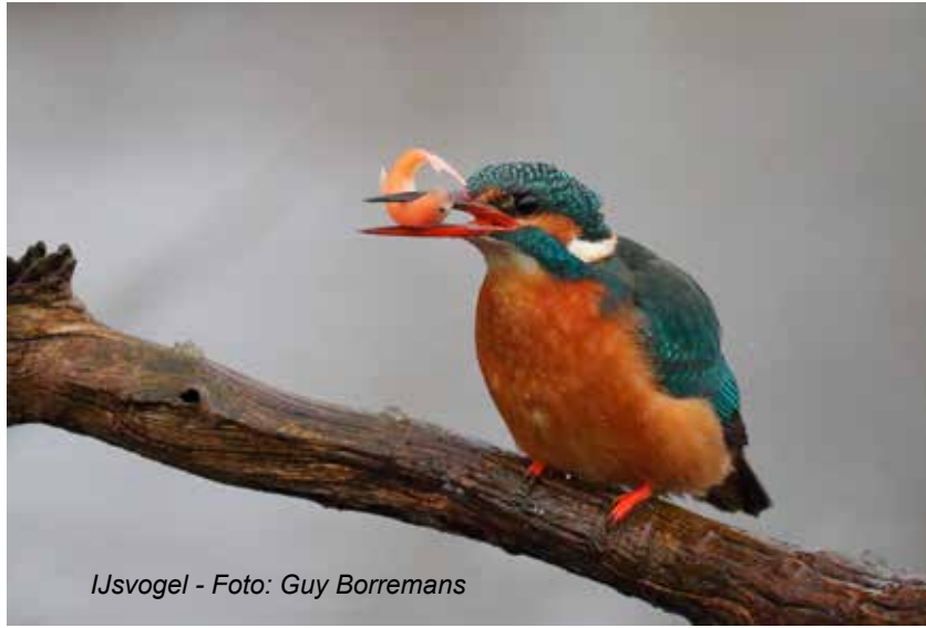
Ijsvogel - Foto: Guy Borremans

Tussen 8/11 en 11/12 werden slechts 5 x een solitaire barmsijs spec. waargenomen langs de Oude Spoor-