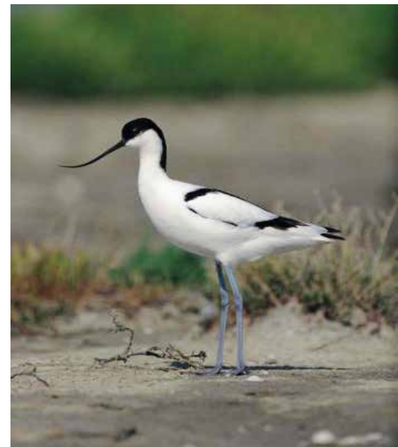
De kluut is een broedvogel van Kortbroek

We eindigen omstreeks 17 u in de Duiventoren in Bazel, hopelijk op het terras waar je ook nog iets kan eten. Van hieruit kan je zelfstandig (of in groep) terug naar het veer fietsen. Voor de echte die hards is er nog de mogelijkheid om vanaf 19.30 uur mee naar bevers te gaan speuren aan de Rupelmondse Kreek. Vanaf één uur voor zonsondergang (20.30 u) is de trefkans best groot. In dat geval fietsen we in groep terug zodat we de laatste veerboot van 22 u naar Hoboken halen.