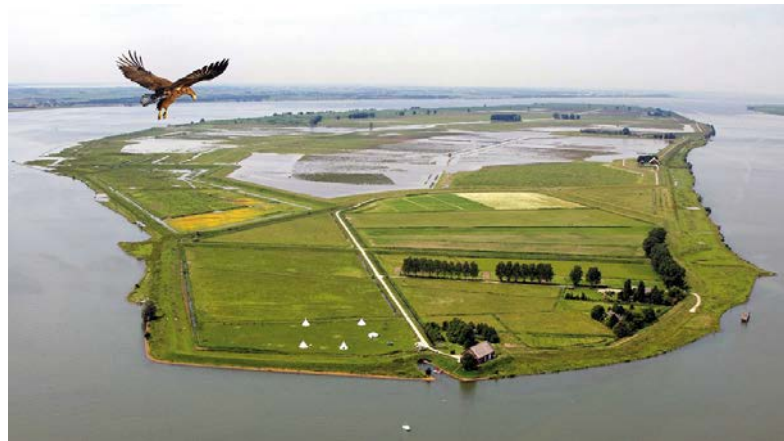
Het eiland Tiengemeten

Afspraak om 11.15 u met eigen wagens (kostendelend vervoer 7 cent/km) aan 't Spant, Boomsesteenweg 335 Wilrijk.