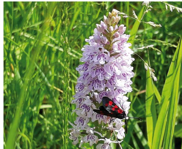
Bosorchis met St-Jansvlinder

Meebrengen: stevig schoeisel, loep, verrekijker, eventueel zonnecrème en een drankje