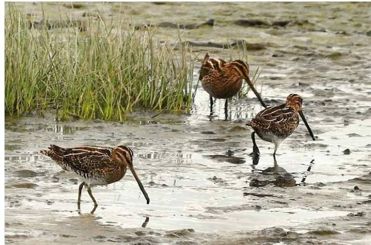
Watersnippen in het Zennegat

We vertrekken om 8.30 u vanaf de parking aan de Boomsesteenweg 333, Wilrijk (ter hoogte van 't Spant).