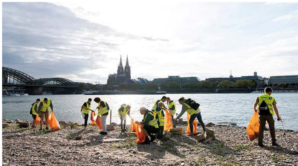
Zwerfvuil ruimen langs de Rijn in Keulen - 2018

We rekenen op uw aanwezigheid om na uw gedane inspanningen van een propere Schelde te kunnen genieten. Meer praktische info in onze kalender.