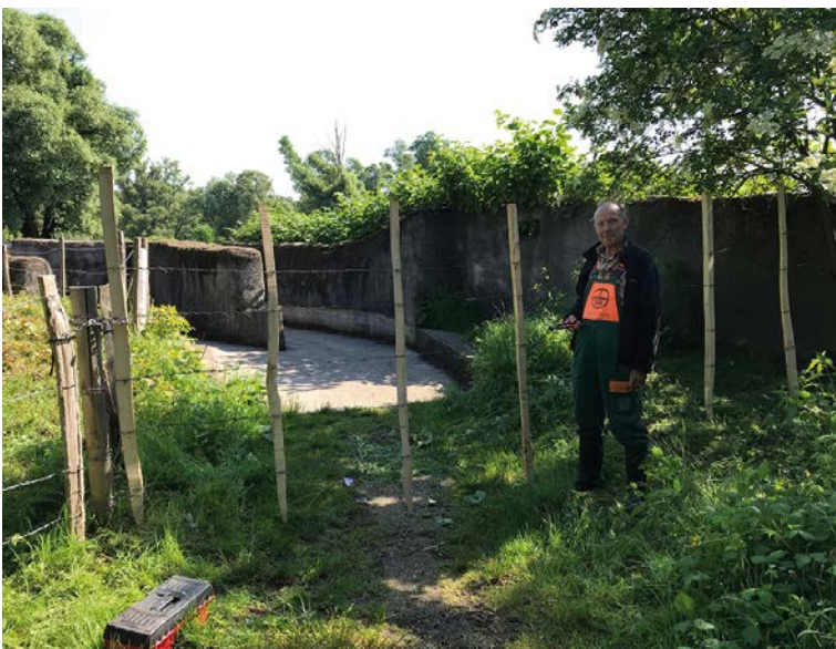
Het afgesloten Kijkpunt De Dodaars

het Hoogveld (of Vergeten End) in het centrale deel (De Schakel, Leerexpert A. Leyweg 10 en 14), het Sibloveldje, het Salamanderpad, het Polderke van Thys, het Kompasveld en de omgeving van de United Caps. Het zijn allemaal plekken waar we meermaals zullen moeten terugkomen om de Japanse duizendknoop onder controle te houden met maaien, uittrekken en uitspitten.