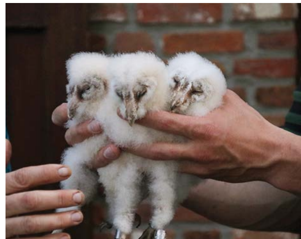
3 jonge kerkuilen, daar doen we het voor!