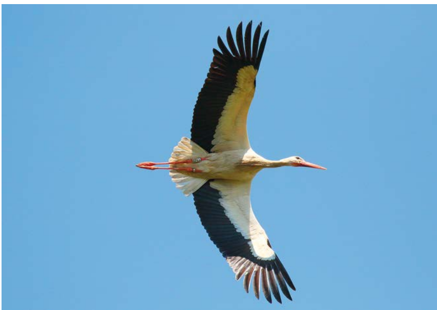
Ooievaar in de vlucht

Op 21 april trok een 2de kj grauwe/steppenkiekendief noordwaarts over Burcht, spijtig genoeg te ver van de trektellers Hobokense Polder om tot een juiste determinatie te komen (WR, MM).