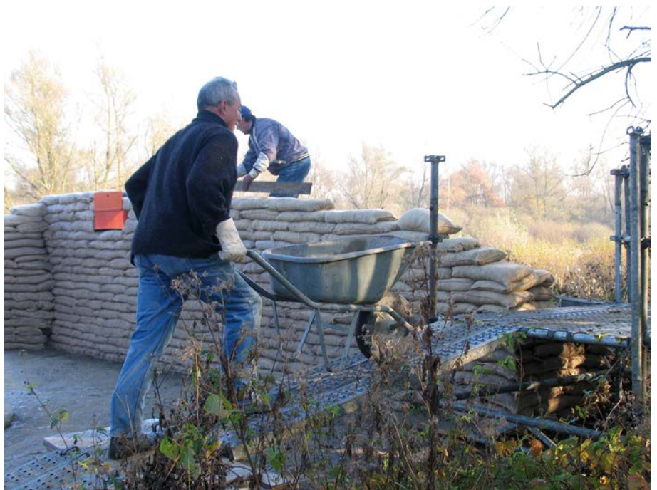
De eerste zandzakken werden gelegd in november 2006

In de toekomst zullen de runderen dus de kijkgaten vrijhouden van Japanse duizendknoop. De bouw van het KIJKpunt startte in september 2006. Na ongeveer één jaar noeste arbeid hadden onze vrijwilligers en vele helpende handen voldoende zandzakken gevuld en geplaatst en was de wand af. Na één jaar doken echter reeds grote problemen op. Met de traskalk, die we als ecologisch alternatief voor cement gebruikten, bleek het zand in de zandzakken niet voldoende uit te harden. De leverancier van het product had ons nochtans verzekerd dat traskalk even goed was als cement. Toen het jutte van de zakken verging, kwam ook het zand los. Zo stond het hele bouwwerk eigenlijk al in 2008 op instorten. Onze architecten werkten toen een noodplan uit. Een laag spuitbeton moest de wand recht houden. Dat heeft die iets meer dan 10 jaar gedaan, maar echt sterk was die laag niet. Door insijpelend regenwater en vorstwerking traden al snel barsten op die steeds groter werden. We zouden nu kunnen opteren voor een nieuwe laag spuitbeton, maar dat is een dure oplossing die bovendien weinig duurzaam is gebleken.