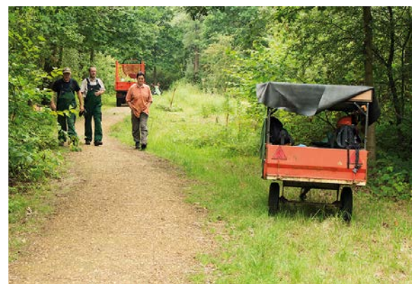
Weekendbeheer in de Polder

Afspraak om 9 u aan de containers achter United Caps. Geef een seintje aan Wim of Danny dat je komt. Voor ieder voorzien we een lekkere koffiekoek en een bakje koffie of thee.