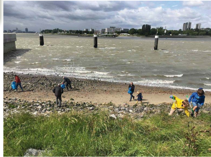
Zwerfvuil ruimen in Antwerpen op 8 juni 2019

Zelf voorzien: degelijk schoeisel (het kan glibberig zijn op de helingen)