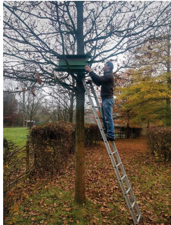
Ophangen van een steenuilkast