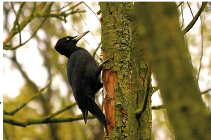
Zwarte specht - Foto: Guy Borremans

335, Wilrijk (ter hoogte van 't Spant) Kostendelend samenrijden (7 cent/km) Einde ter plaatse rond 12.30 u. Meebrengen: verrekijker, vogelgids en naar keuze picknick (zie boven) wandelschoenen volstaan bij droog weer.