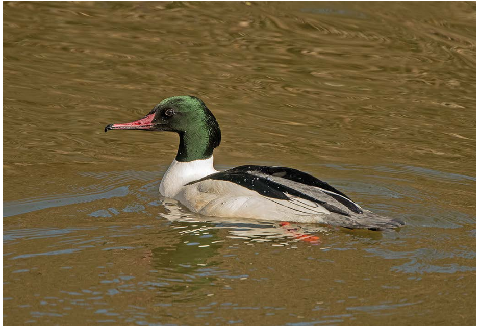
Grote zaagbek

Tussen 4 maart en 13 april trokken minimum 43 grutto's noordwaarts