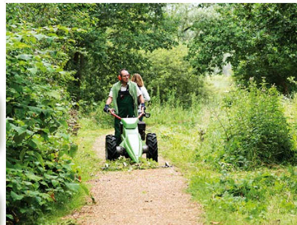
Weekendbeheer in de Polder