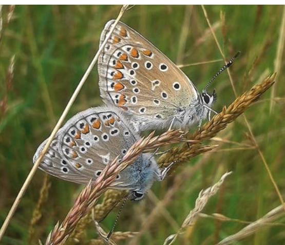
Icarusblauwtjes - Foto: Marnix Lefranc