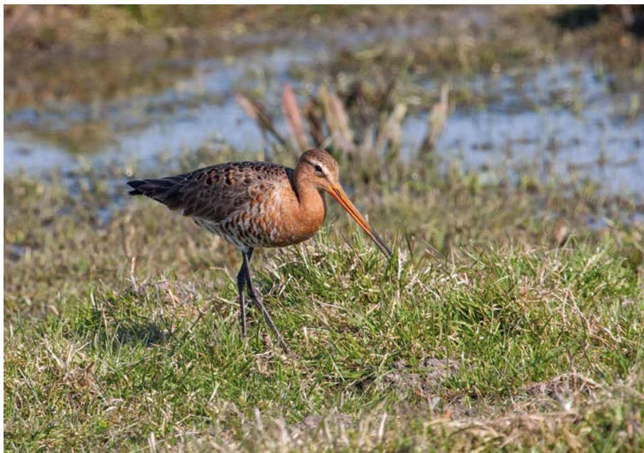
Grutto - Foto: Luk Smets

Het was weer een erg gevuld voorjaar voor Ardea. Tellingen en inventarisaties, nestkasten opvolgen, reisvoorbereidingen en natuurlijk ook enkele heel interessante excursies. De excursie naar het Turnhouts Vennengebied op 1 mei sprong er toch wel wat uit. Met ongeveer 30 deelnemers en een erg bekwame gids maakten we er kennis met een erg geslaagd natuurbeschermings- en -herstelproject. Het Vennengebied is als het ware een nieuw netwerk van vele kleine lapjes natuur, heroverd op de grootschalige bos- en landbouw. Stukjes heide vormen er nu het geschikte biotoop voor heidevogels als nachtzwaluw en boompieper. En vele natte, extensief beheerde weilanden zijn er een paradijs voor weidevogels. Zo'n 70 broedpaartjes grutto zijn hier nu (terug) te bewonderen. Wat een fijne ervaring was dat, zo'n positief natuurverhaal. Echter, aan de andere kant van de weg zagen we 'rijke weilanden' voor onze voeten gemaaid worden door grote allesverslindende maaimachines. Wég waren plots de kansen voor Kievit en veldleeuwerik.