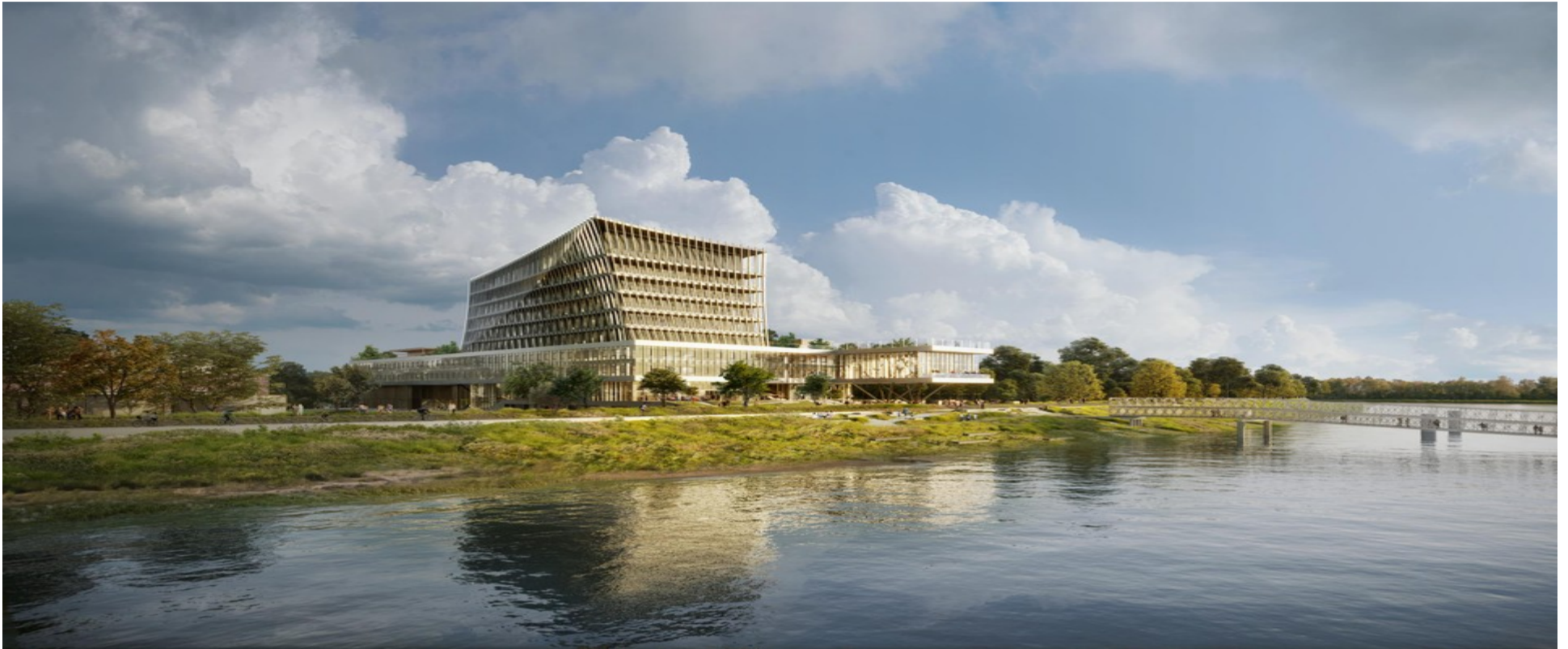
Een toekomstbeeld van de campus.

Scheepvaartbedrijf CMB heeft een omgevingsvergunning gevraagd voor een zone van 40.000 vierkante meter en een gebouw van 45 meter hoog. Er zullen normaal gezien 500 tot 700 mensen aan het werk gaan. Het is de bedoeling de site daarna uit te breiden. Op termijn is het de bedoeling er tientallen Europese bedrijven te huisvesten in een broeihaard voor innovatie en vergroening in de scheepvaart. Dat betekent: nog aanzienlijk meer gebouwen en werknemers. Over die uitbreiding volgen nog gesprekken met de stad Antwerpen.