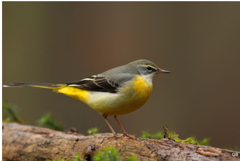
Figuur 1 – Grote Gele Kwik

Holenduif: broedvogel Kievit: 1 broedgeval Witgat: pleisteraar