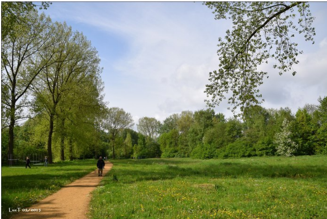
Figuur 3 - "Het Geitenpad" in de Vallei van de Kleine Struisbeek

Het vrijmaken van de oevers door kapbeheer, en eventuele slibruiming, van de twee aanwezige poelen zal voor een rijker waterleven zorgen. Dat zal ongetwijfeld ook voor het vogelbestand een verbetering kunnen opleveren. We denken dan hierbij aan dodaars als mogelijke broedvogel.