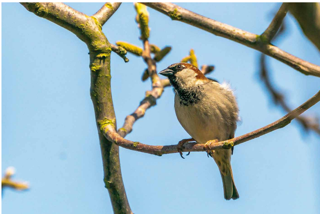
Huisemus