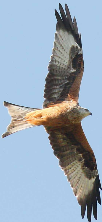
Rode wouw

De enige waargenomen zwartkopmeeuw vloog op 1 januari over het Olympisch Stadion "Het Kiel" (WDR).