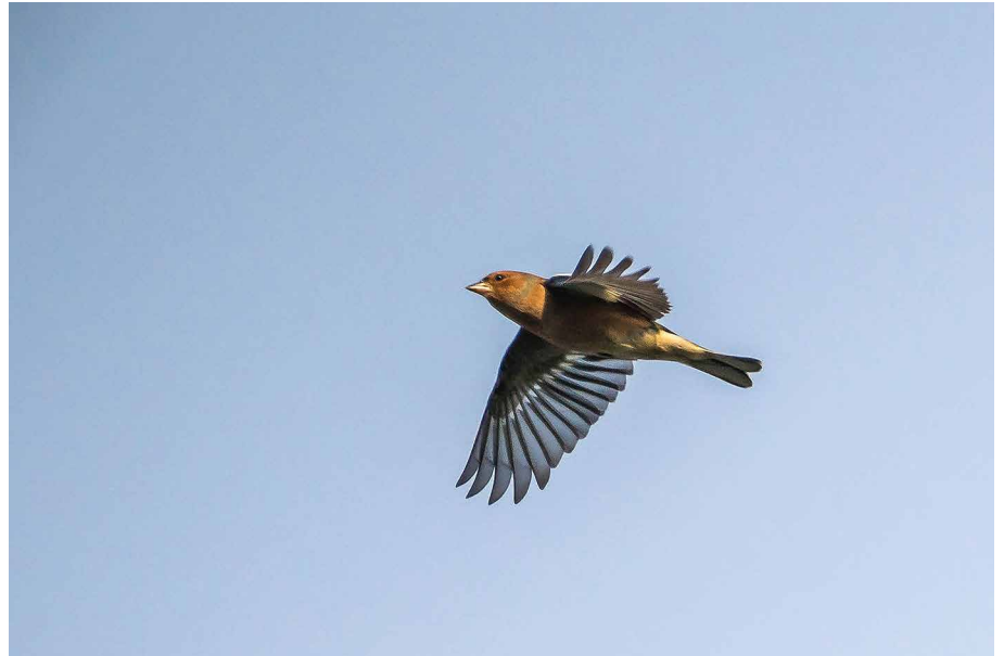
Vink in de vlucht

visarend (2), grauwe-/steppekieken-dief (1), rode wouw (3), smelleken (1), velduil (2), waterpieper (3), kruisbek (2), ijsgors (1), geelgors (1).