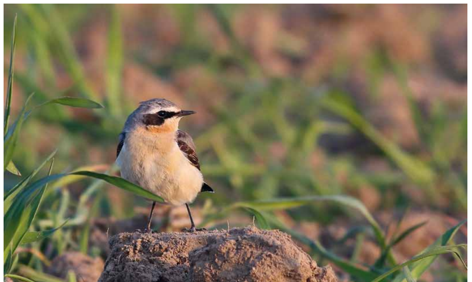
Tapuit - Foto: Steven Van den Bussche

Park Vogelzang/Antwerpen: 1 paar medio februari (RL, LVS).